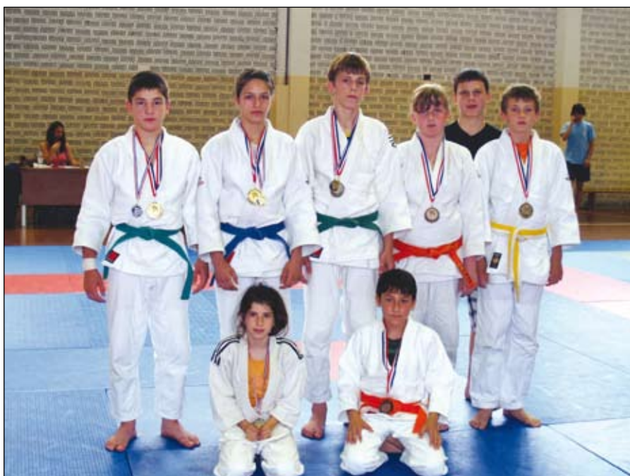
Uspešen nastop mlajših tekmovalcev JK Duplek v Solinu