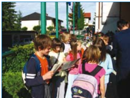
Pred odhodom še pregled zloženke.

Tehnična delavnica je potekala v učilnici za tehnični pouk. Naloga učencev je bila izdelati pet kažipotov, ki bodo kazali pot do Glonarjeve domačije. V likovni delavnici so učenci ustvarili doprsni kip iz gline. Učiteljica jim je