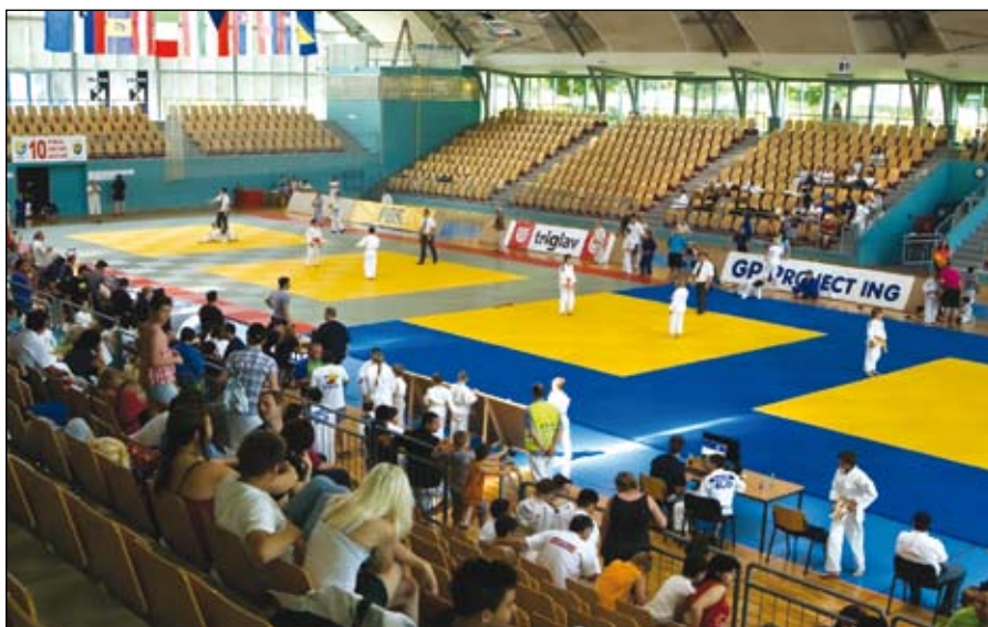
Pogled na prizorišče Pokala občine Duplek 2010 v judu