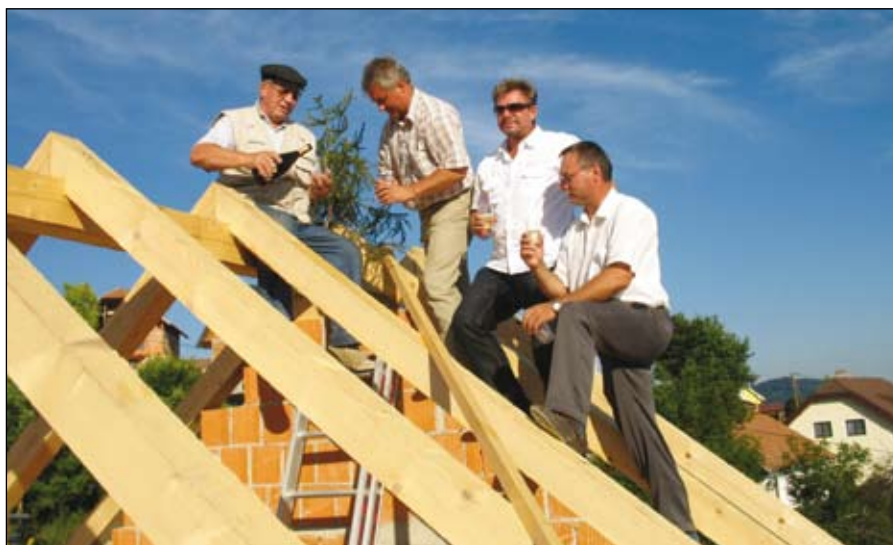
Gradnja poteka po predvidenih rokih, tako da se bodo lahko prizadeti vselili v novo hišo predvidoma že konec oktobra.