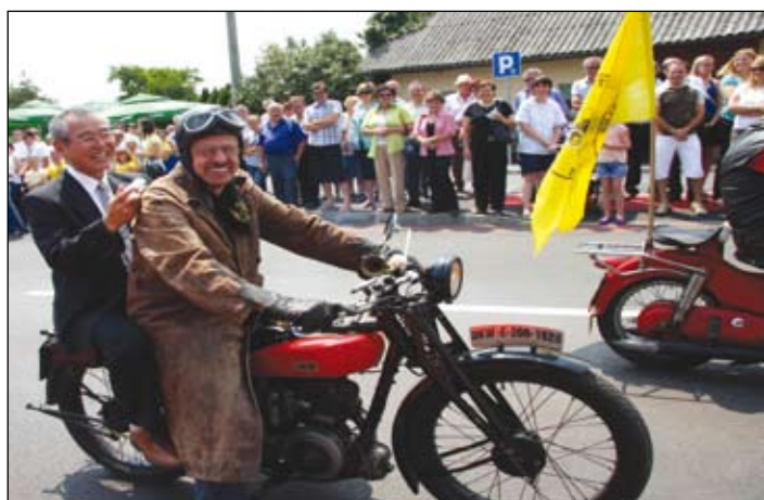
V bogatem sprevedu so sodelovali tudi lastniki starodobnikov. Nekateri so se z njimi tudi popeljali. Na sliki gost iz Japonske na starodobnem motorju.