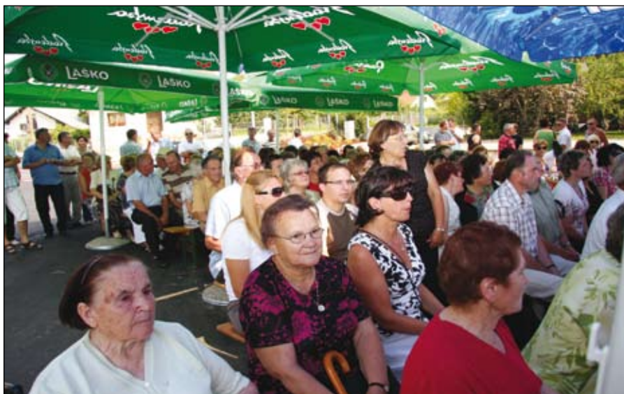
Nedelja, zadnji dan praznovanja, se začela s sveto mašo pri kapeli pred občino.