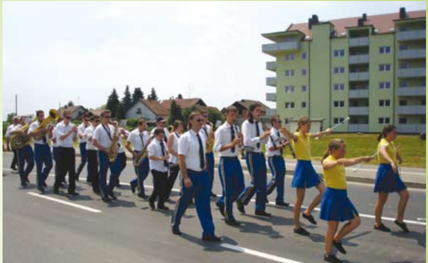
Naš najljubši pihalni orkester – Pihalni orkester občine Duplek in mažoretke sredi povorke

Praznik občine Duplek vsako leto znova navduši in razveseli številne občane. V tem času se zvrstijo številne prireditve, ki prinašajo veselje ljudem v občini in tudi zunaj nje. Najbolj pa sem vesela, da lahko del tega veselja omogoči tudi naš mažoretni klub. Vsako leto sodelujemo na zaključni prireditvi ob prazniku občine Duplek in tako imamo čudovito priložnost, da se predstavimo s svojim znanjem, ki ga pridno pridobivamo na vajah in treningih. Naše znanje in spretnosti rastejo iz dneva v dan. Verjamem, da smo številnim obiskovalcem polepšali prireditve ob zaključku Dupleškega tedna v nedeljo, 4. julija. Po aplavzu sodeč, so jim naše koreografije ugajale in so uživali ob našem nastopu. Trudile se bomo tudi v prihodnje in obljublamo, da bomo še naprej pridno vadile in se marsikaj novega naučile. Tako bomo lahko svoje bogato znanje ponovno pokazale na naslednji zaključni prireditvi ob prazniku občine Duplek.