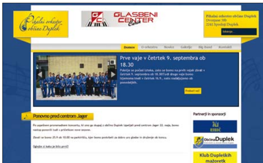
Spletni naslov: www.orkester-duplek.si

Poleg spletne strani smo že nabavili, v kratkem bo nameščena, zvočno izolacijo prostora za vadbo, primerljivo z izolacijo glasbenih studiev. Zaradi manjše kvadrature vadbenega mesta v Domu kulture v Dvorjanah se namreč ubadamo s prevelikim odmevom prostora. Problem bo tako odpravljen ali vsaj korenito zmanjšan.