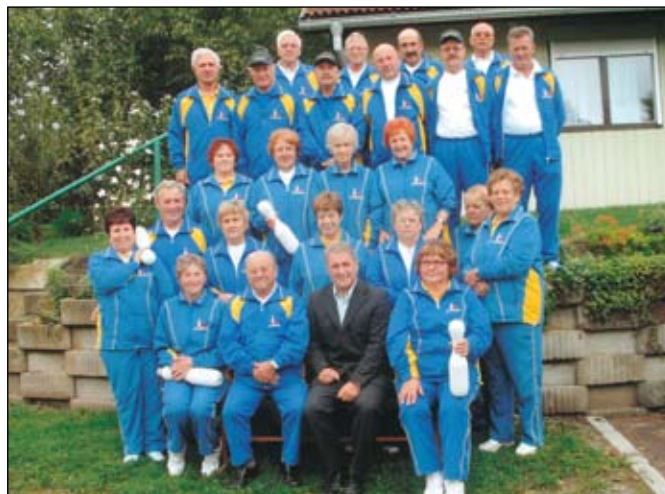
Kegljaška sekcija v novih športnih oblačilih