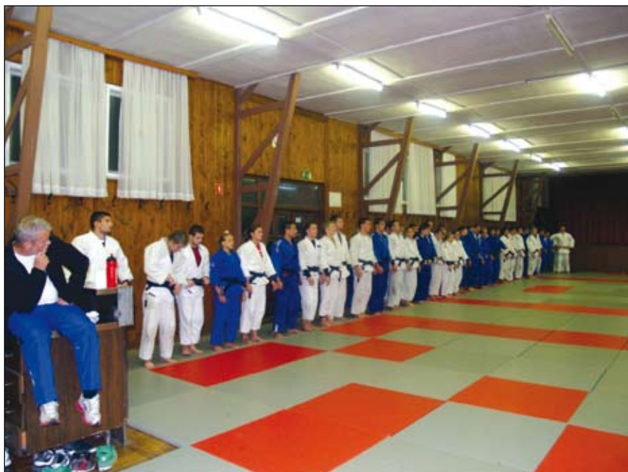
»Baraka« je večkrat premajhna za vse ljubitelje juda.