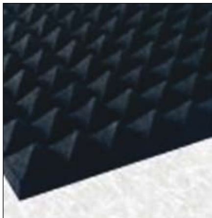
Zvočna izolacija (plamafon)

Z orkestrom smo bili v začetku leta uspešni na treh javnih razpisih Javnega sklada Republike Slovenije za kulturne dejavnosti, tako da smo dobili odobrena sredstva za sofinanciranje naslednjih projektov: postavitev spletne strani, nakup zvočne izolacije za zvočno izpopolnitev vadbenih prostorov in za nakup trobente. Konec julija je tako zaživela naša prva uradna spletna stran, dostopna na naslovu www.orkester-duplek.si . Na njej lahko najdete informacije o aktualnih nastopih, kontaktne obrazce, če želite z nami sodelovati, informacije o orkestru in big bandu, si ogledate galerije in spremljate, kaj pravzaprav počnemo. Svojo stran smo oblikovali tudi na spletni mreži Facebook, kjer pridno zbiramo prijatelje.