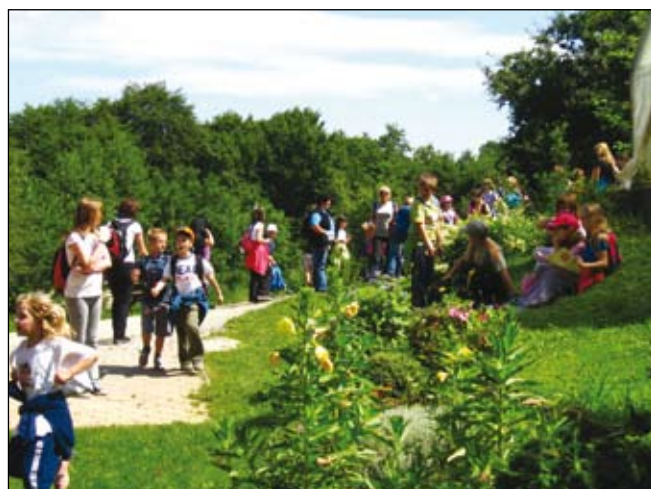
Pred zaključkom poti še obisk Leničeve domačije.

bilo prijetno in prav tako vzdušje. Na posameznih točkah smo pokramljali z domačini in bili prijazno pogoščeni s prigrizki, pecivom in osvežilnimi napitki.