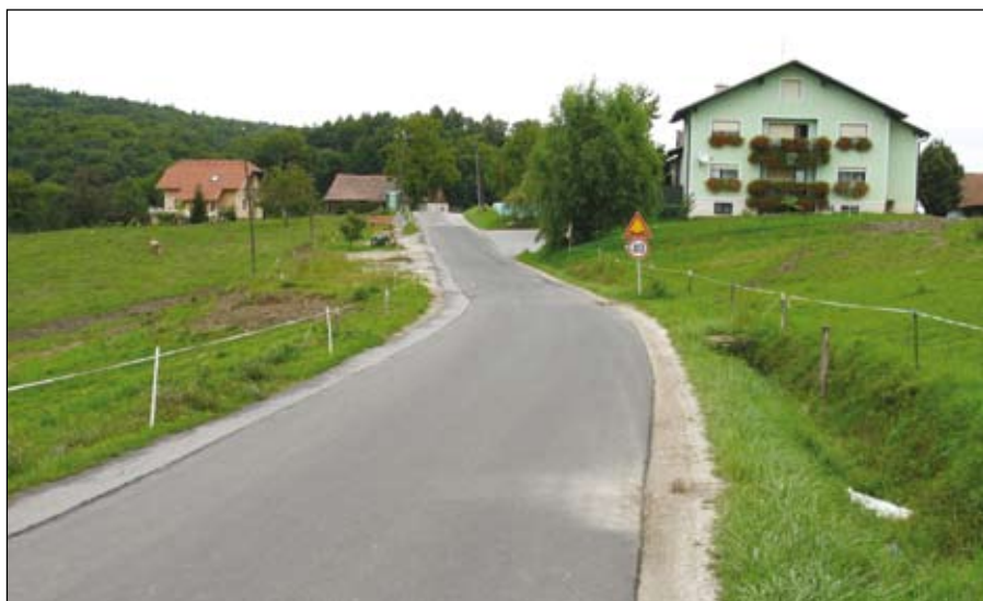
Plaz: LC št. C 081020 Zg. Duplek-Zimica-Korena.

Na osnovi pripravljene državnega Programa odprave posledic neposredne škode smo za obnovo občinske infrastrukture pripravili sanacijske elaborate in naročili izvedbeno projektno dokumentacijo za najbolj prizadeto občinsko cesto in porušeni most