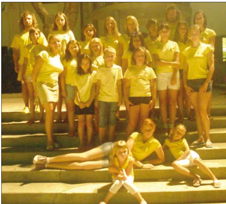
Skupinska slika vseh mažoretk (iz Dupleka, Benedikta in Lenarta) v dupleški rumeni barvi po nastopu

Vsako leto komaj čakamo na poletje, a priznajmo si, da se veselimo tudi začetka šolskega leta. Mažoretke smo že ujele delovni ritem in se pripravljamo na novo mažoretno sezono, ki bo letos še bolj pestra, razgibana in vsekakor tudi napornejša od lanske. Navsezadnje smo eno leto starejše in sposobnejše.