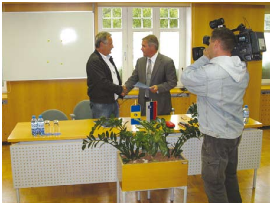
Podpis pogodbe s podjetjem Poštrak d.o.o.

Občina Duplek si je že dalj časa prizadevala zagotoviti sredstva za gradnjo glavnega kanalizacijskega kanala v Zgornjem Dupleku z navezavo na CCN