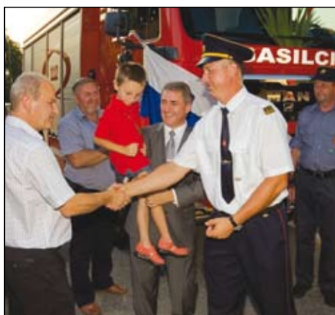
Svečana predaja ključev.