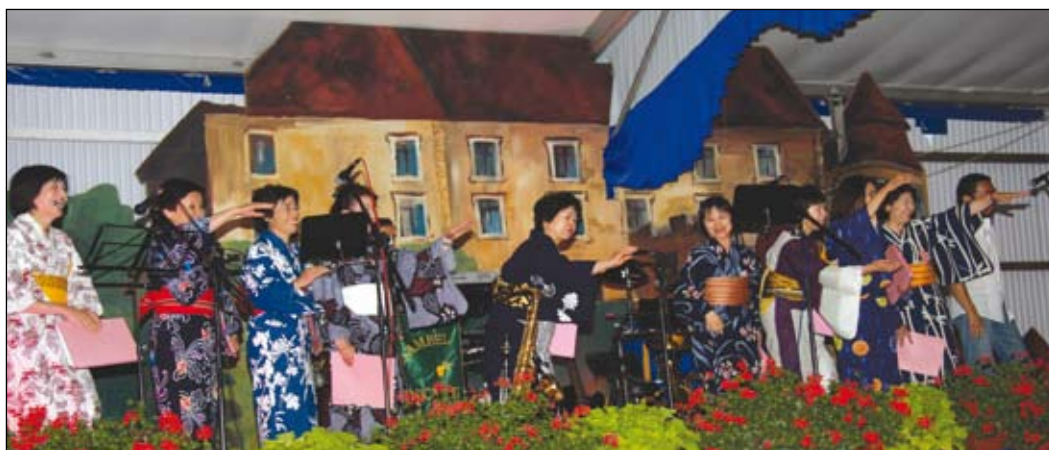
Na zaključni prireditvi je tudi letos nastopile pevke gostje iz Japonske.