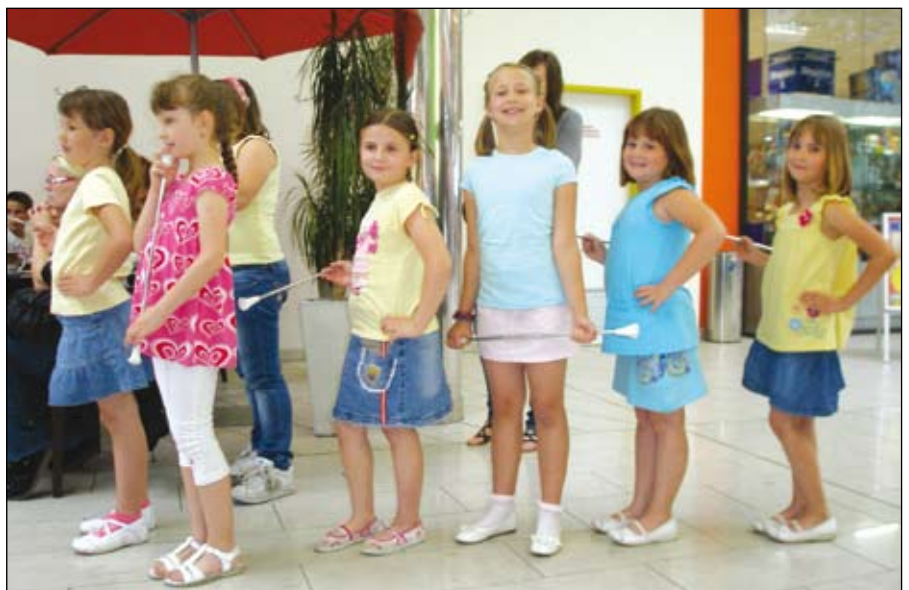
Pred nastopom Delfinčkov in Žabic

sijo v marsičem novem. Meni se je zdelo zelo zanimiva hoja po vrvi – slack