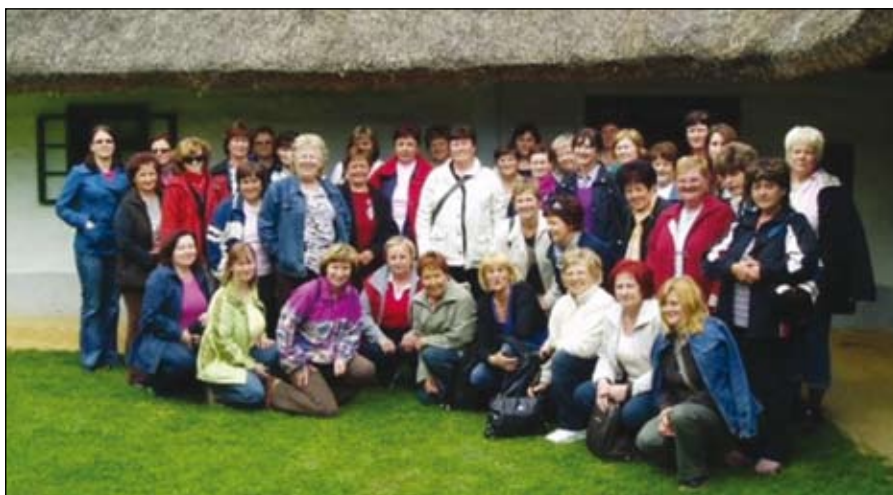
Udeleženske izleta v lončarski vasi Filovci