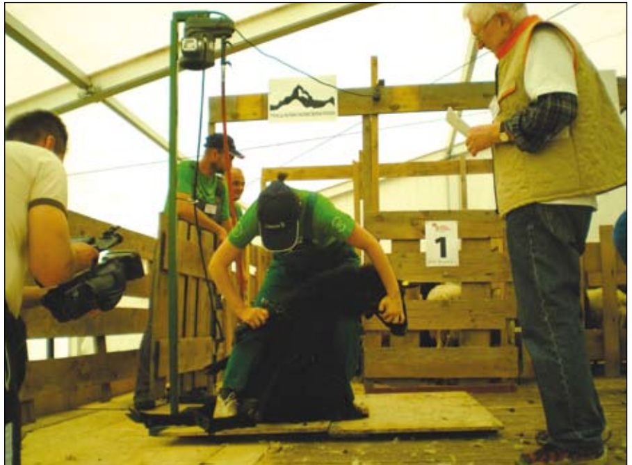
Na tekmovanju sem strigla tudi črne ovce.

Namen tekmovanja je izboljšati raven oskrbe živali, med prireditvijo poteka mnogo predstavitev, izmenja se mnogo izkušenj in mnenj, kar na koncu doprinese k večji ozaveščenosti ljudi in večji skrbi za dobrobit živali. Prav tako imajo na takem srečanju možnost predstavitev vsi, ki se ukvarjajo s pridelavo in predelavo ovčjega mesa, mleka in volne. Stalež drobnice se v Sloveniji vsako leto povečuje in nobena skrivnost ni, da so meso in mlečni izdelki pašnih