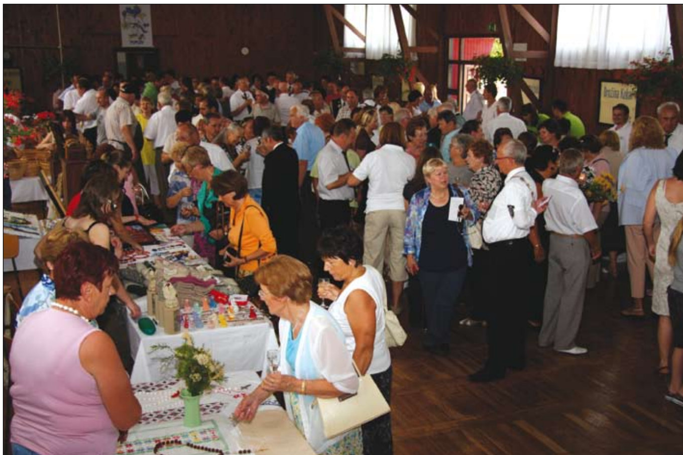
Na prireditvenem prostoru je sledila otvoritev razstave Dnevi ustvarjalnosti, ki so jo s predstavitvijo na stojnicah tudi letos popestrili različni rokodelci ter kmečke žene in vinogradniki.