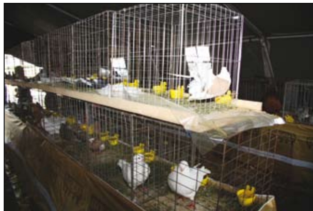
Z razstave malih živali.