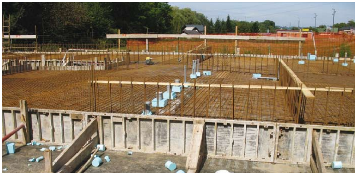
Gradbišče v Zgornjem Dupleku.