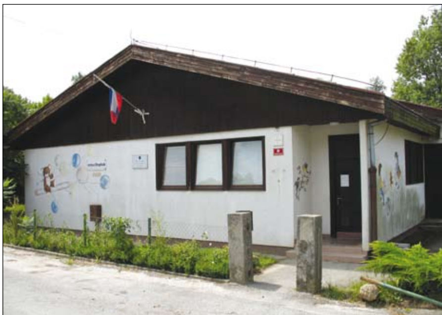
Vrtec v Zg. Dupleku le še spomin, na tej lokaciji že raste nov vrtec.

Kljub državni pomoči je investicija za občino velik zalogaj, zato smo se odločili za pridobivanje evropskih sredstev. Pripravili smo prijavo na razpis za pridobitev sredstev iz evropskih skladov, in sicer za projekte z varčno rabo energije. V ta namen smo projektno dokumentacijo spremenili tako, da bo novozgrajeni objekt energijsko varčen do največje možne mere – v strokovnem jeziku se takšna gradnja imenuje pasivna.