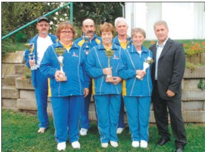
Občinski prvaki z županom