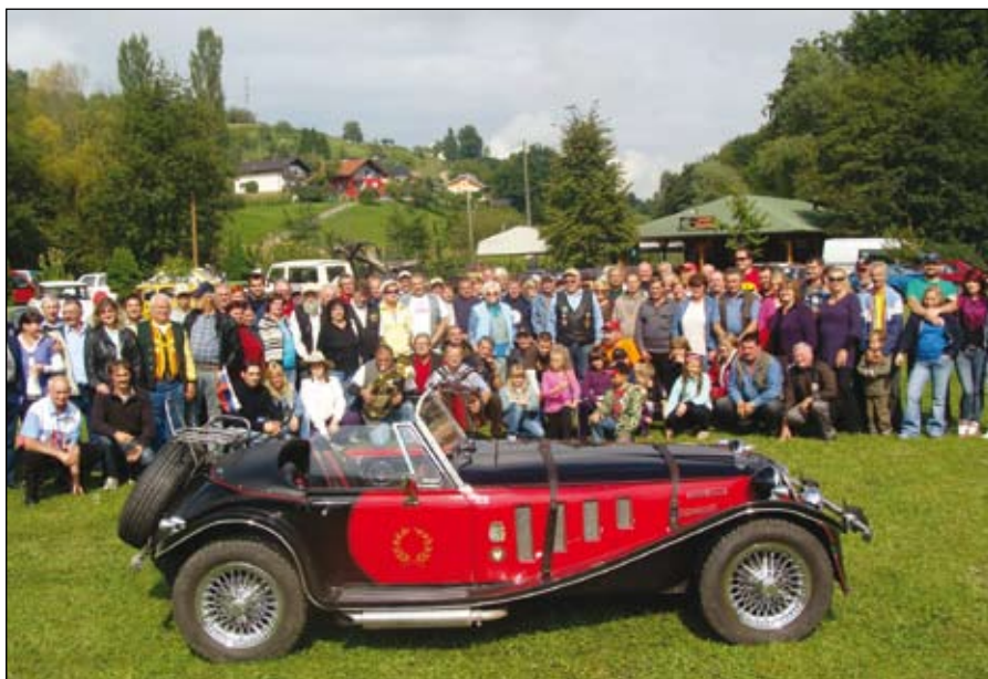
Udeleženci enajstega srečanja oldtimerjev Duplek.