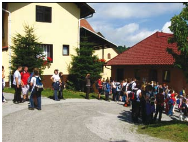
Postanek pri Ekartovih in Simoničevih.

Pohoda so se udeležili učenci od 1. do 9. razreda OŠ Korena, učitelji, starši, krajanji in gostje iz občine Duplek. Vreme je