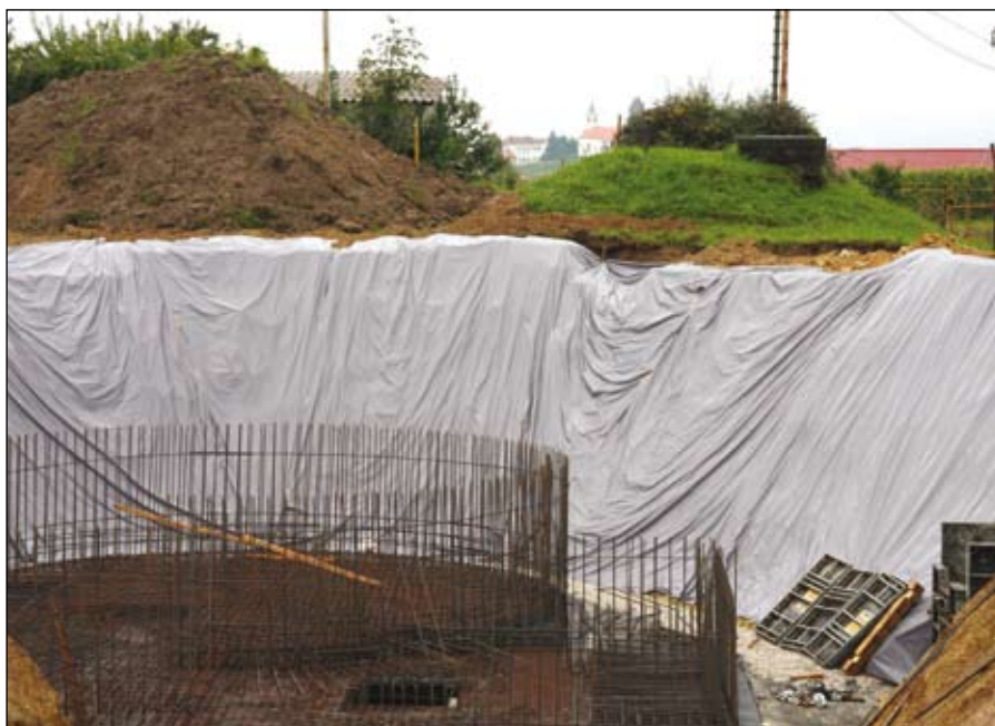
Gradbišče v Žikarcah.

Pri prenovi vodovodnih priključkov pa se pojavljajo problemi zaradi zasebne lasti priključka. Njegov lastnik je namreč uporabnik, priključek ni v javni lasti ali last občine. Zaradi te lastnine, ki je z zakonskimi akti tako določena, obnovo plača lastnik. Njeni stroški, predvsem tam, kjer je priključek daleč od sekundarnega cevovoda ali poteka pod cesto, pa so zelo visoki in zato precej obremenijo lastnike. Toda naj bo kakorkoli, tudi tega področja obnove se bomo morali lotiti