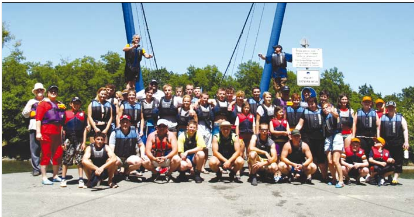
Zadovoljni udeleženci raftinga JK Duplek na cilju v Apačah.