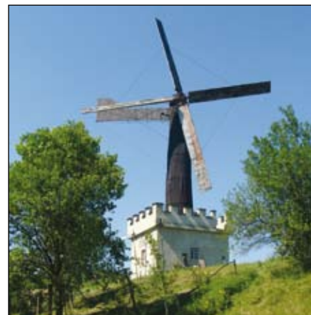
Mlin na veter.

Jurovski Dol leži na obrobju Pesniške doline, med rekama Pesnico in Ščavnico. Površina občine je okoli trideset kvadratnih kilometrov in šteje dva tisoč prebivalcev in šeststo gospodinjstev. Demografsko je manj razvita, delež starejših je nad 30%. Večinoma so kmetije, nekaj je storitvenih dejavnosti - gradbeništva, trgovine, dopolnilnih dejavnosti na kmetijah. Ceste so povečini asfaltirane. Središče se ponaša s štiristo let staro gotško cerkvijo sv. Jurija.