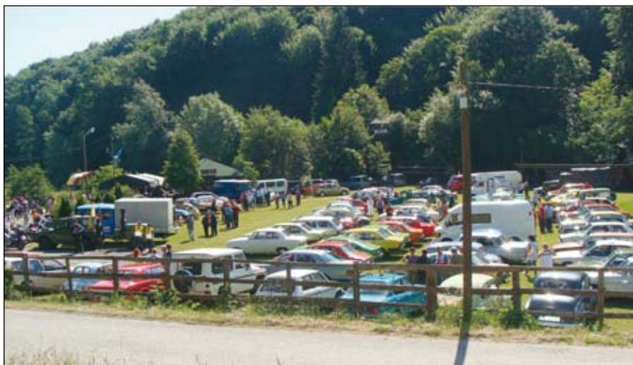
Zbiranje na prizorišču srečanja.

Grad je zanimiv sam po sebi, kraj pa je poimenovan po hrastu, ki je prevlado-