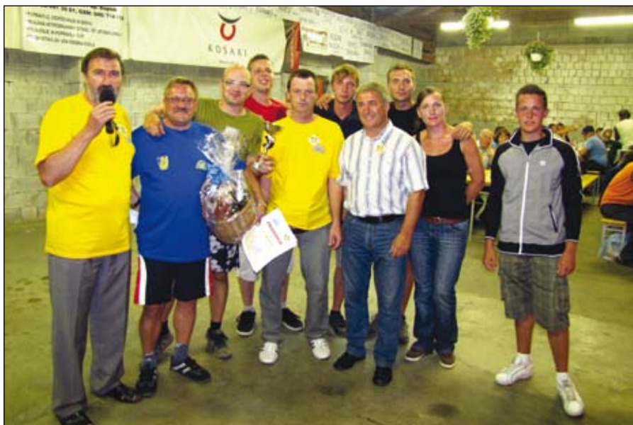
Zmagovalna ekipa ŠD Zimica.