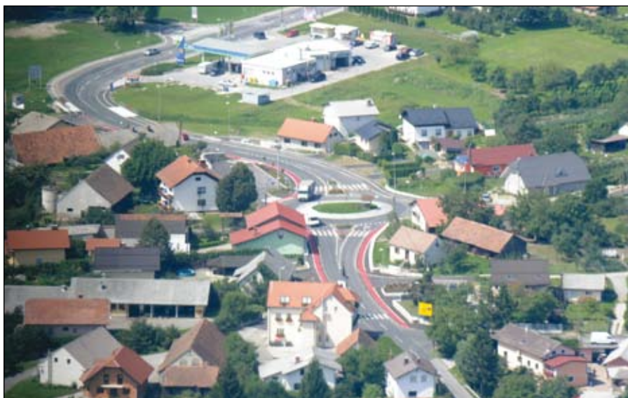
Z rekonstrukcijo ceste je in ureditvijo krožišča je Sp. Duplek zelo spremenil podobo.

pod šotorom. Tam je bil petkov večer rezerviran za mlade, hkrati pa je tega dne bila predana namenu za občino pomembna pridobitev, to je obnovljeni del ceste od bencinske črpalke do občinske zgradbe in krožišče.