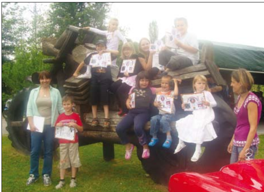
Mladež na lesenem motorju.