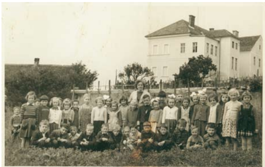
Prvi razred leta 1960.

S prijetnimi občutki smo zapuščali šolo in se skupno odpravili proti gostišču Siva čaplja v Trnovski vasi. Da je bilo druženje še lepše, smo s seboj prinesli