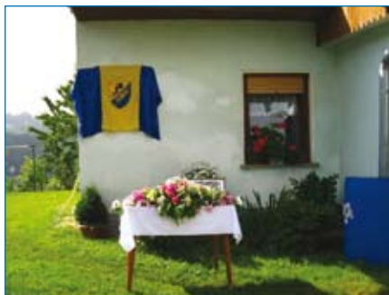
Pred odkritjem spominske plošče.

Pohod udeležencev rekreativne delavnice do Glonarjeve domačije je potekal