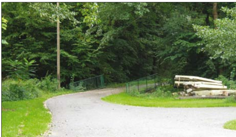
Most: JP št. C 581390 Zg. Duplek (Lovrenčič-Kolmanič).