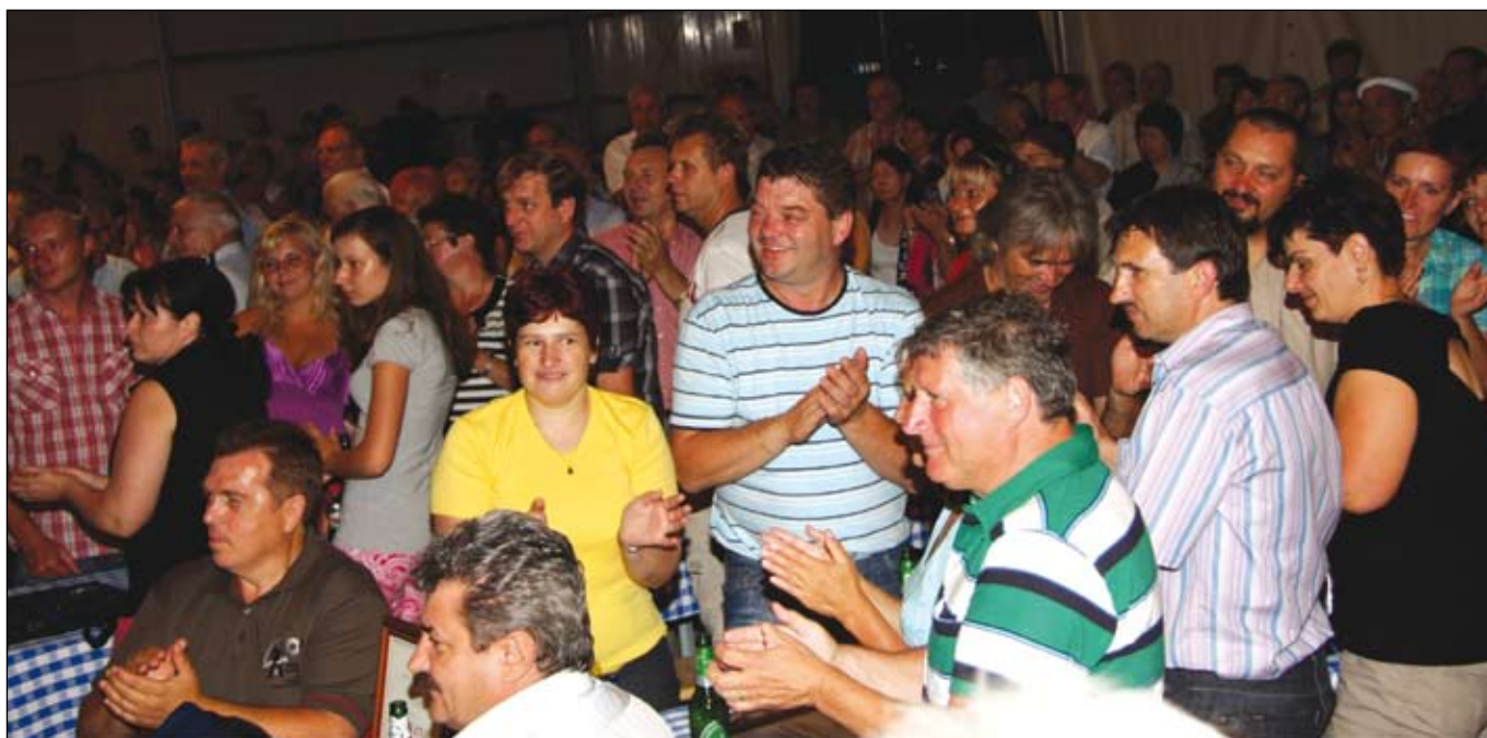
Zaključek je bil kot se spodobi. Številne obiskovalce na prireditvenem prostoru sta navdušila...