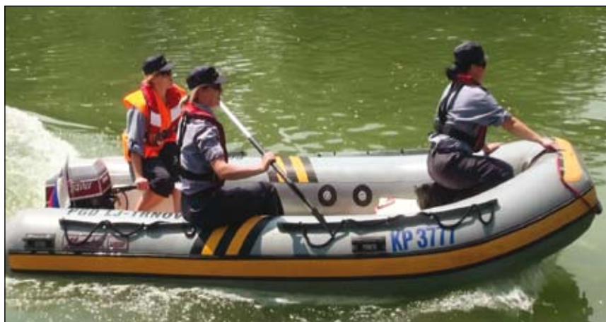
Enakopravne po gasilsko – gasilke iz Trnovega v Ljubljani.