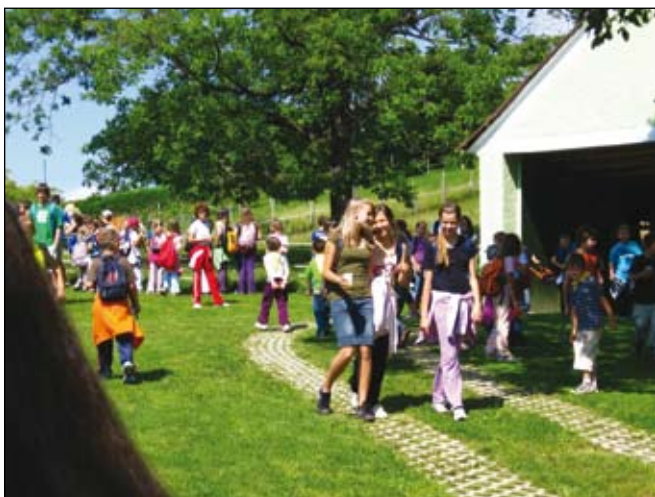
Na obisku pri Rapičevih.