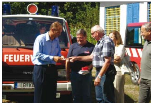
Predaja ključev vozila.