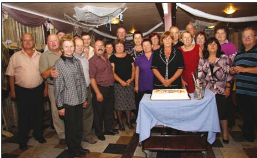
Po 50 letih.

darilca s posvetilom in se obdarili. S plakata smo prebrali misli, ki smo jih napisali 23. maja 2008, na našem srečanju ob 40. obletnici zaključka 8. razreda.