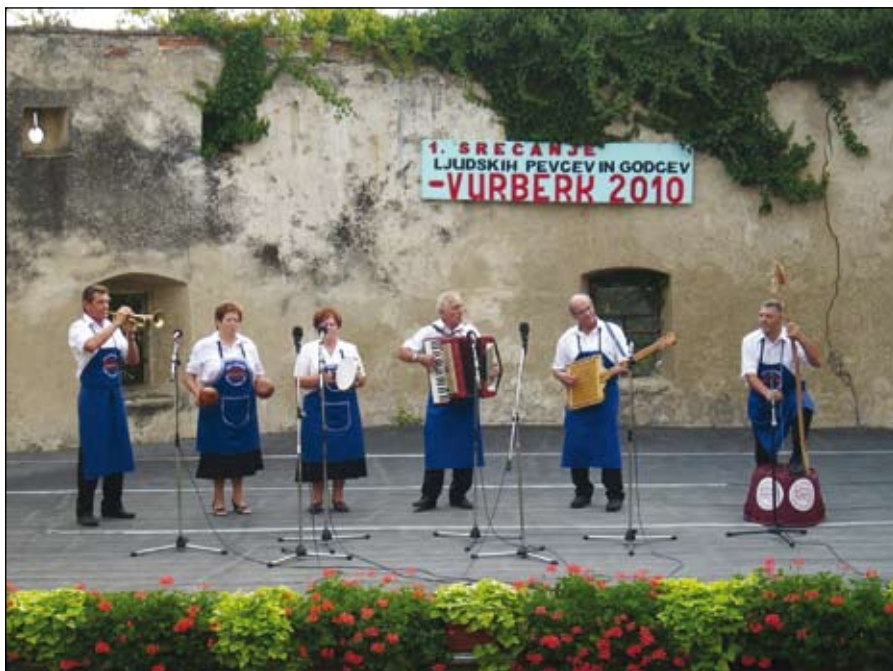
Prvo srečanje vaških godcev in pevcev na grajskem dvorišču Vurberk.

Prispelo je vseh 16 prijavljenih skupin: Ljudski pevci DPD Svoboda Pragersko, upokojenke DPD Svoboda Ptuj, Žanjice PD iz Cirkovc, Stare korenine iz Maribora, Samotarji DU iz Hoč, Ljudske pevke PD Ruda Sever iz Gorišnice, Gasilske ljudske pevke iz Oseka, Ljudske pevke KUD Tončka Breznarja iz Korene, Ljudski pevci iz Stoperc, Ljudski godci Vetrnica iz Male vasi, Ljudske pevke iz Porabja na Madžarskem, Ljudske pevke iz Juršincev, Njivski kvintet iz Velenja, Zimzeleni iz Oplotnice, Ljudske pevke iz Jablovca in Muzikanti iz Markovcev. Vseh 96 nastopajočih je s pesmi-