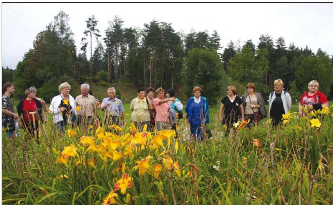
Članice Društva kmečkih žena občine Duplek so se proti koncu meseca avgusta odpravile na ekskurzijo v sosednjop Avstrijo, kjer so si ogledale park in se nato povpele do cerkve svete Eme na Koroškem.