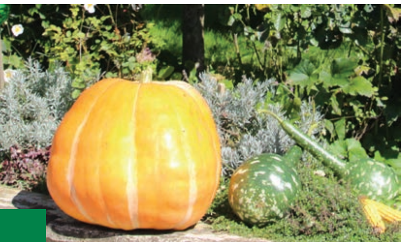
Domači kmetijski pridelki