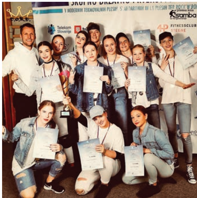
S trenerjem in soplesalci ob osvojenem naslovu državnih prvakov (mini produkcija – generalno)

Vanese je koreografinja in plesalka skupine C. O. R. E. v kategoriji mini produkcija – generalno, ki je dosegla 1. mesto na državnem prvenstvu.