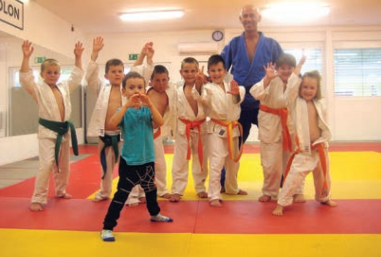
Aikido vrtec otroki starosti 5+