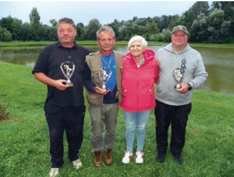
Zmagovalci s predsednico DU Duplek

Po dobrih treh urah, ko se je že vedelo, kako izgleda velik ulov in kdo je njegov lastnik, je bila uradna razglasitev rezultatov.