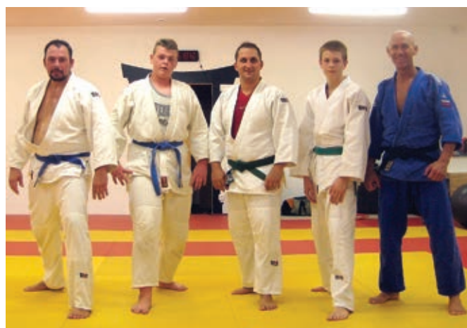
Aikido odrasla skupina 15+

Da se izognemo tem neljubim dogodkom, smo za vas v naši akademiji pripravili sklop vadb in treningov za ljudi vseh starosti, pri katerih se nam lahko pridružite kadarkoli v letu in skupaj z nami zaživite zdrav življenjski slog v športnem duhu, pozitivni energiji, dobri volji, s skupnimi močmi bomo premagovali vsakdanji stres in tako zaživel boljši jutri. Od svojih vadečih punc in fantov velikokrat slišim, da jih naslednji dan vse boli in da že komaj čakajo na naslednji trening! Zakaj je tako? Iz preprostega razloga – naslednji dan po dobrem treningu sledi prijetna bolečina mišic (utrujenost), ki že z naslednjim treningom izgine. Še vedno smo velika družina vadečih in na vse sem zelo ponosen, ker vem, da je za uspehe treba pošteno garati!