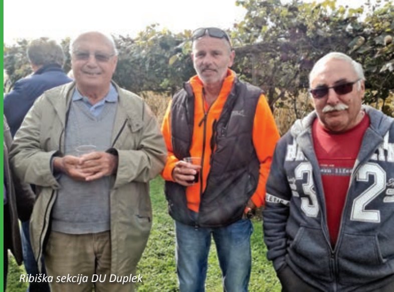
Ribiška sekcija DU Duplek