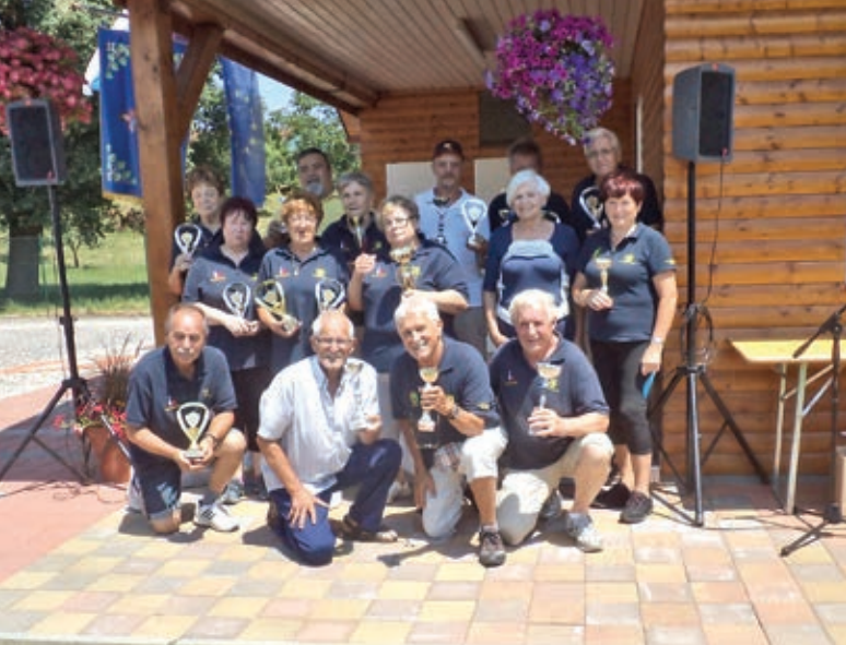
Ženska ekipa Duplek 1. mesto • Moška ekipa Duplek A 1. mesto Moška ekipa Duplek B 2. mesto