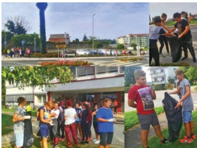
Fotografija september18: Učenci OŠ Duplek so se priključili čistilni akciji

V petek, 14. septembra 2018, smo se kot šola udeležili čistilne akcije. Ure so bile skrajšane in takoj po malici smo krenili na delo.