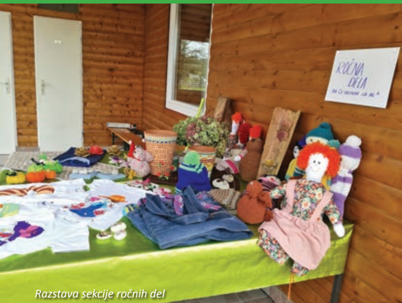
Razstava sekcije ročnih del