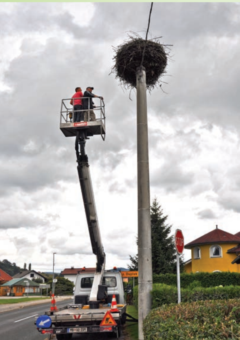
Obročkanje štorkelj je potekalo v oblačnem in deževnem vremenu. Zg. Duplek, 25. 6. 2018.

Pretegovanje in urejanje perja, Sp. Duplek, 13. 7. 2018.