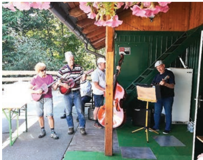
Pohod Turističnega društva Duplek in častnikov slovenske vojske