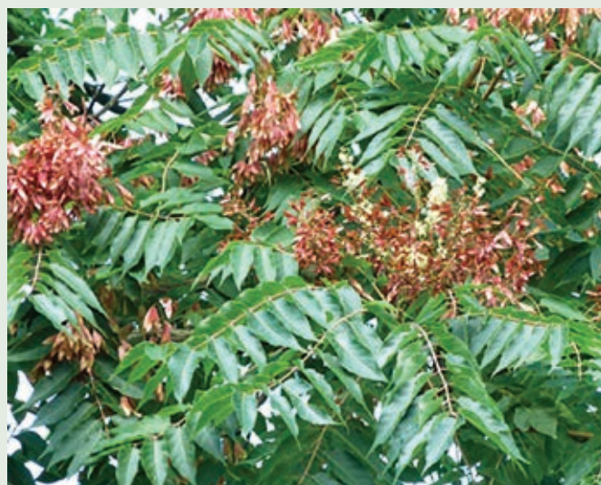
Veliki pajesen