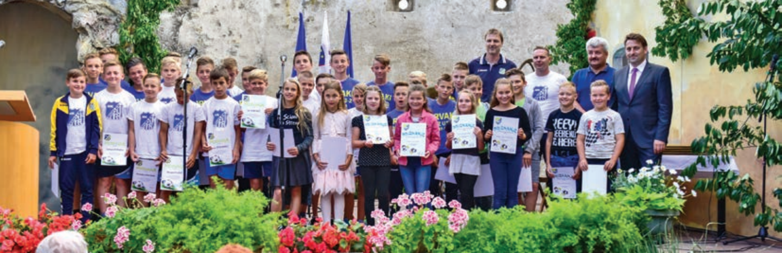
Športniki ob podelitvi priznanj