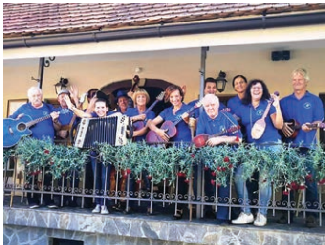
Nastop tamburaškega orkestra v Framu