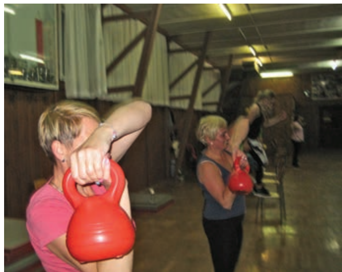
Skupinska vadba z utežmi