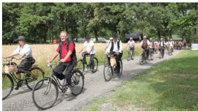
Zavihteli smo pedale

Množica ljubiteljev starih koles, junija 2018 v Dupleku