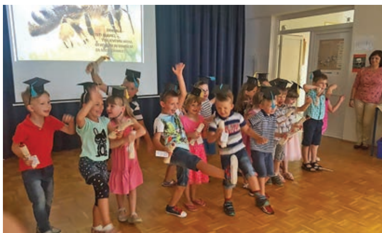
Srčni, igrivi, razigrani – mini maturanti!