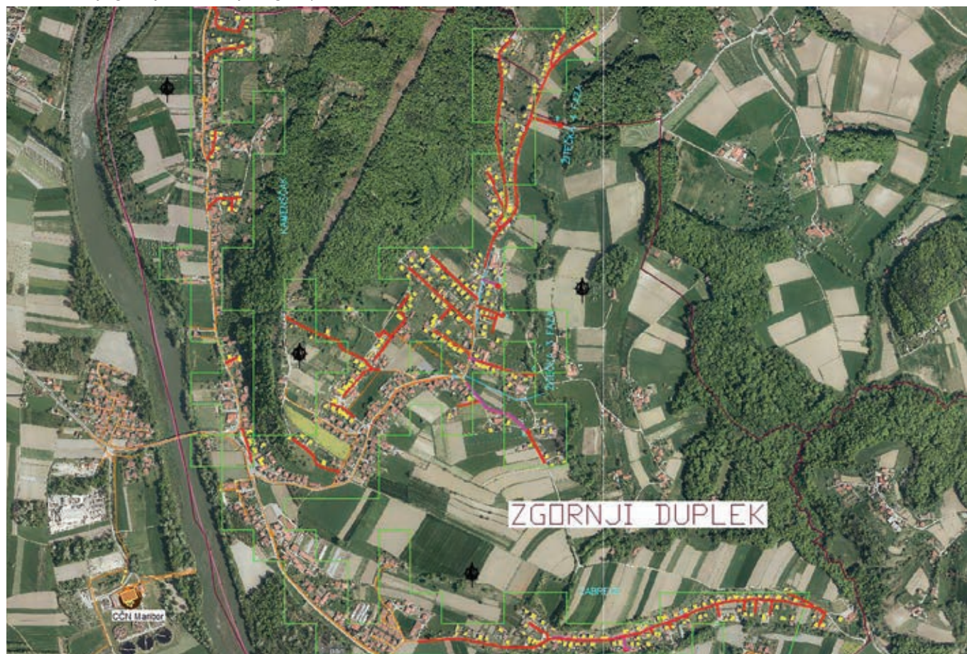
Prikaz območja gradnje kanalizacije v Zg. Dupleku