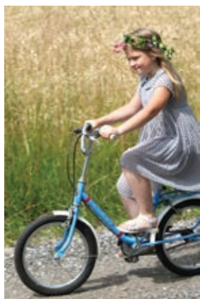
Mlada članica društva Oldtimerjev

Zelo spoštljivo in lepo je bilo videti dve družini po tri generacije, in prav je, da se v to tradicijo vključuje tudi podmladek