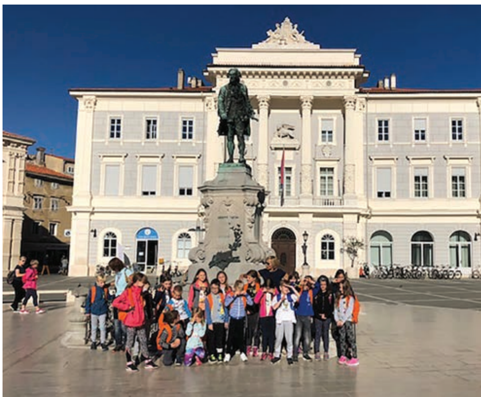
Tartinijev trg v Piranu