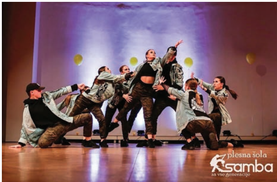
Produkcija plesne šole Samba