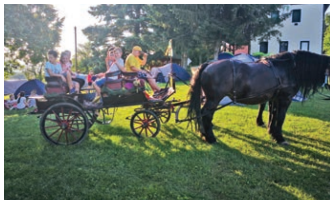
Voznja s kočijo je bila pravo doživetje

Spali smo v šotoru, zakurili smo si ogenj, peljali smo se s kočijo, hodili smo na sprehode. Pekli smo si penice, šli