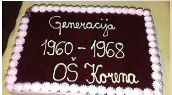
Kot se za okroglo obletnico spodobi - tortica

Po pozdravnem nagovoru Jožice Perić smo se z enominutnim molkom spomnili pokojnih sošolcev, sošolk, učiteljev, ki jih ni več med nami.