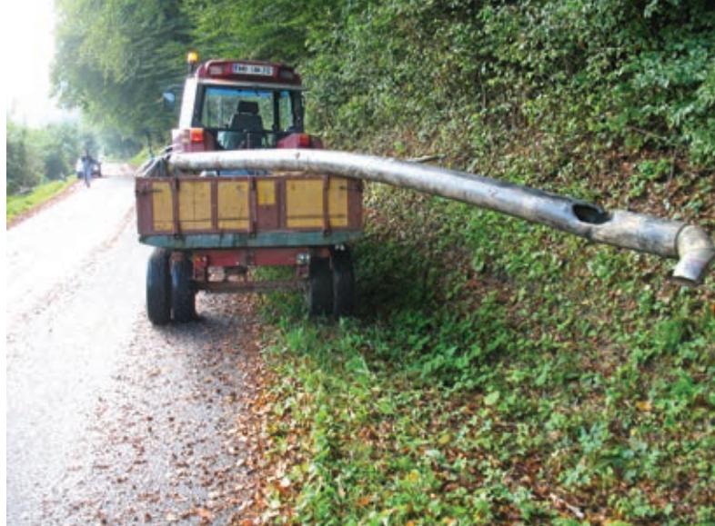
Počistili smo marsikaj, kar ne sodi v naravo