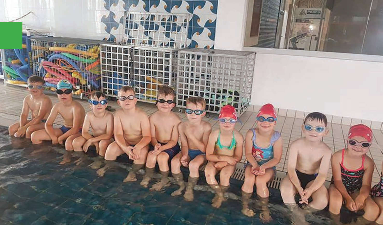
Očala – obvezna oprema za gledanje pod vodo