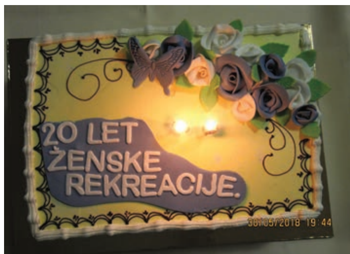
Tortica s katero smo se posladkale ob zaključku telovadne sezone

Kot se za okroglo obletnico spodobi, smo podelile diplo-