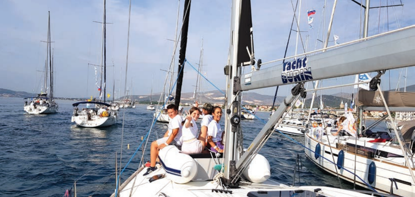
Regata se je pričela...