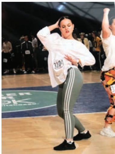
Na evropskem prvenstvu v Bremerhavnu (hip hop)

Na državnem prvenstvu je v disciplini hip hop – članice dosegla neverjeten uspeh in se uvrstila med pet najboljših plesalk v Sloveniji. Z odličnimi rezultati se je udeležila evropskega prvenstva, ki je junija potekalo v Bremerhavnu v Nemčiji. V izredno močni konkurenci 107 tekmovalk je pristala na odličnem 19. mestu. Za primerjavo je vredno omeniti prejšnje leto, ko se je prvenstva udeležila prvič in zasedla 67. mesto.