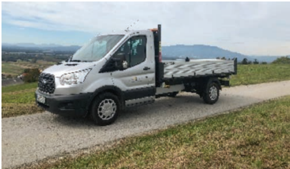
Natalija Jakopec Novo dostavno vozilo

Vozilo znamke Mercedes Benz Sprinter, letnik 1997, ki ga je dolga leta uporabljal režijski obrat, smo bili zaradi dotrajanosti sredi poletja primorani izločiti iz uporabe. Za nemoteno delovanje režijskega obrata, ki med drugim skrbi za vzdrževanje cest in cestne infrastrukture, urejenost zelenih javnih površin, urejenost cvetličnih gredic in pokopališč, smo kupili novo dostavno vozilo Ford Transit z enojno kabino. Vozilo je stalo 24 tisoč evrov in upamo, da nam bo dobro služilo.