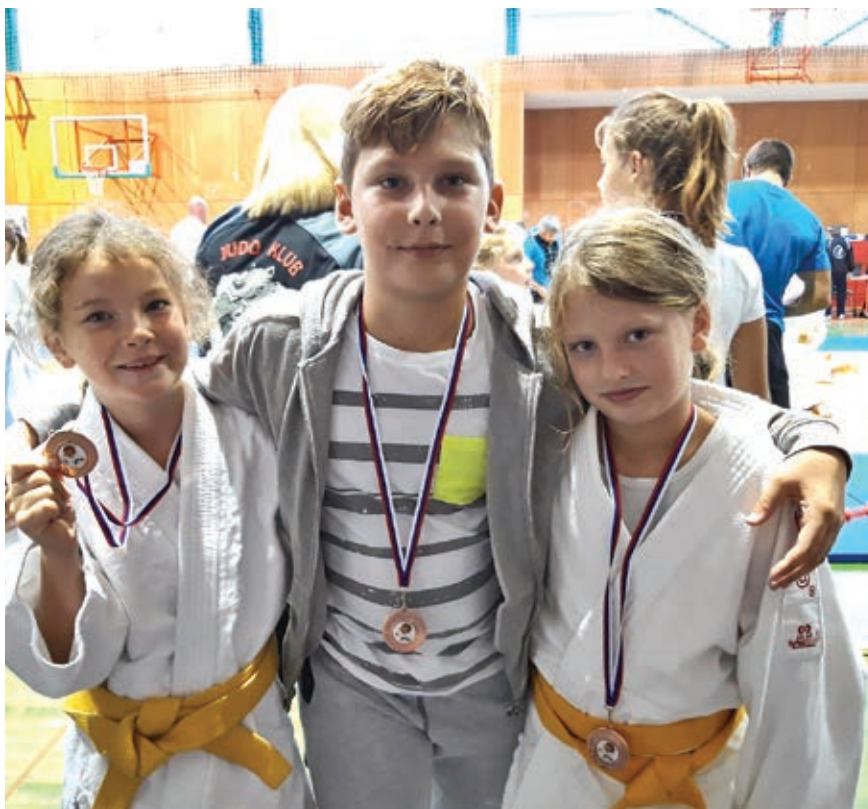
Pokal oplotnice 2018

V nedeljo smo se zjutraj odpravili na otok Čiovo, kjer smo se naužili čistega morja ter se popoldan odpravili nazaj proti domu.