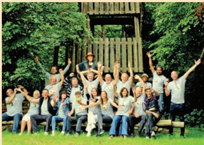
Udeleženci kolonije Duplek Art 9