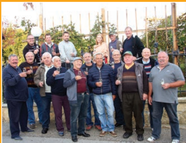
Zaključek trgatve v Žikarcah