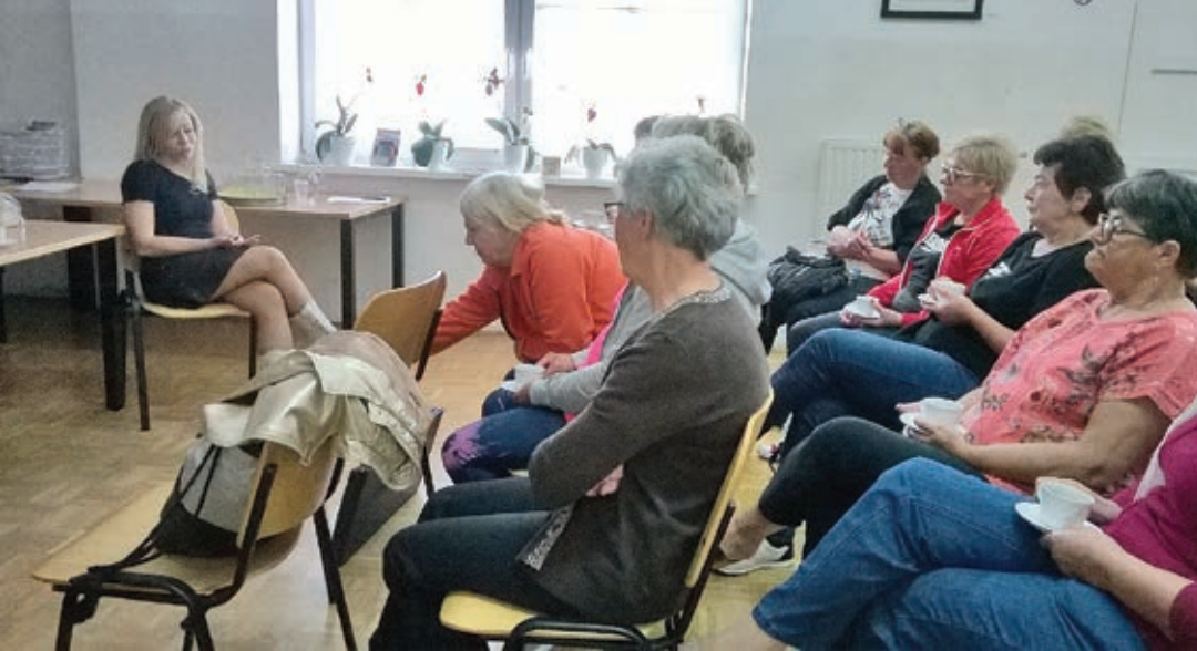
Predavanje Zdrav način prehranjevanja