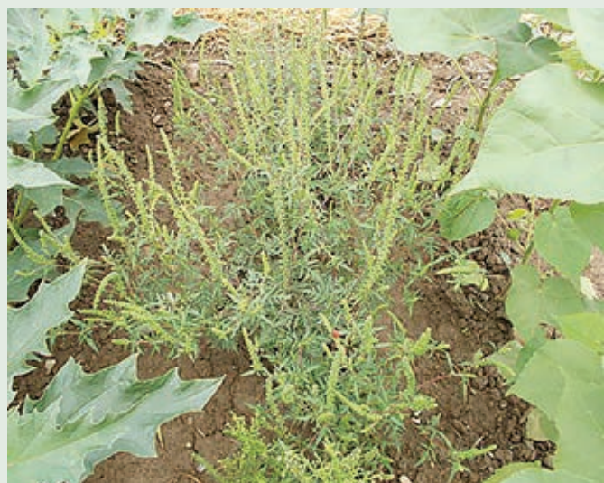
Pelinolistna žvrklja ali ambrozija

Invazivne tujerodne vrste (krajše invazivke) so rastlinske in živalske vrste ter glive, ki jih je človek namerno ali nenamerno zanesel iz območja njihove prvotne razširjenosti in ki s širjenjem poslabšajo življenjske razmere za domorodne vrste. Ugotavljamo, da se rastlinske invazivne tujerodne vrste najprej naselijo na rastiščih ob cestah, vodotokih, na gradbiščih in posekanih površinah v gozdu, kjer je človek odstranil prvotno rastlinje in jim omogočil razrast. Nato se razširijo tudi na naravnejša območja, kjer so vplivi na biotsko raznovrstnost bistveno večji. V javnosti je najbolj znana ambrozija, vendar smo predvsem v gozdovih našega območja pogosto opazili tudi veliki pajesen, pavlovnijo in potencialno invazivno navadno barvilnico.