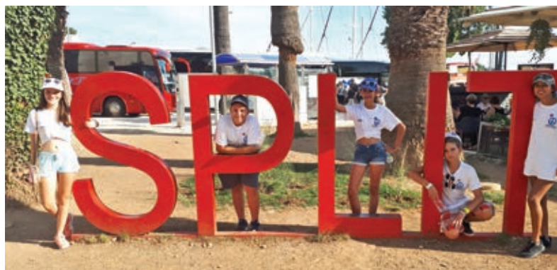
Split je zakon