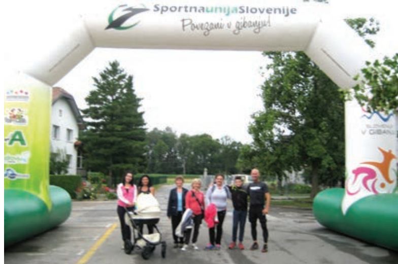
Tek in hoja po krajinskem parku občine Duplek ob občinskem prazniku Bini Akademije