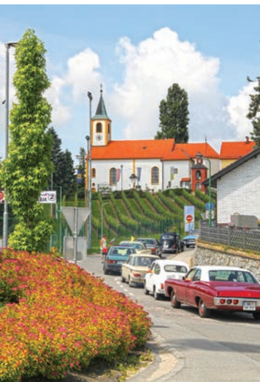
Cerkev Sv. Barbare v Koreni