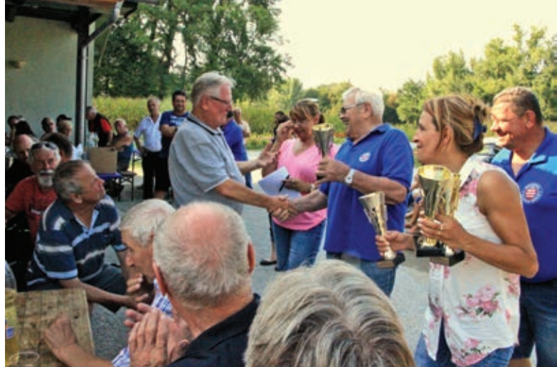
Podelitev priznanj in pokalov