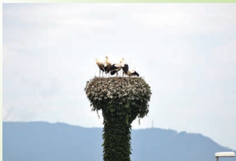
Mlade štorklje pred prvim poletom v svet. Sp. Duplek, 13. 7. 2018.