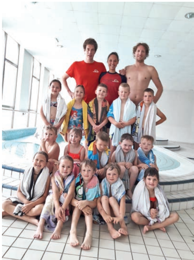
Hura – priplavali smo si srebrne delfine

Učitelji Plavalnega kluba Branik Maribor