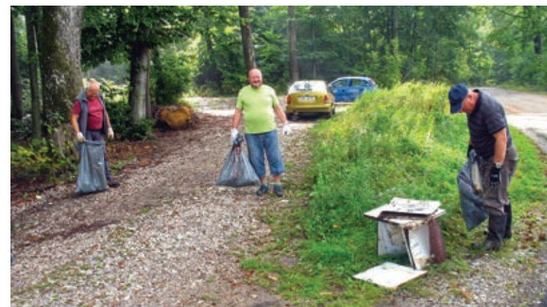
Tudi v gozdu se najde marsikaj