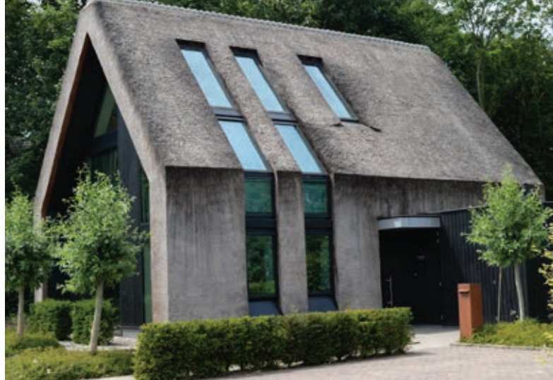
Hiša, ki jo obdaja nizka strižena živica iz tise, drevesa so cepljene vrbe, hiša in vrt sta odlično umeščena v podeželski kontekst

Fastigiata tip habitusa poimenujemo tiste rastline, katerih oblika rasti krošnje ali vej je že na pogled ste-