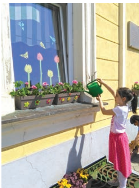
Otroci so posadili rožice

Hvala Vrtnarstvu Tement in RK Dvorjane, da so omogo-