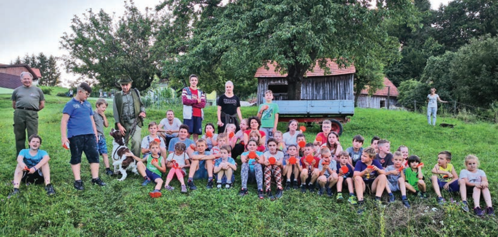
Skupinska fotografija vseh udeležencev