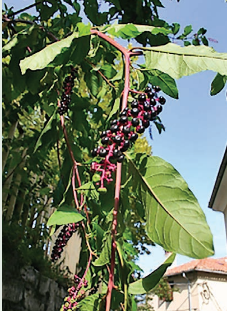
Navadna barvilnica

Navadna barvilnica je razrasla zelnata trajnica, ki je pri dnu lahko nekoliko olesenela. Listi so suličasti, dolgi do 30 cm. Steblo je pri odrasli rastlini običajno rdečkasto. Cvetovi so beli, plodovi jagodasti; nezreli so zeleni, nato beli, zreli so svetleči in temno vijoličasti. Vsako zimo rastlina odmre do korenin. Najdemo jo na robovih goz-dov, nasipališč in njiv. Podobne vrste je krhljasta barvil-nica, ki pa v nasprotju z navadno zraste do 1,2 m, socvet-je in grozdasto jagodičje oz. plodove pa ima obrnjene navzgor.