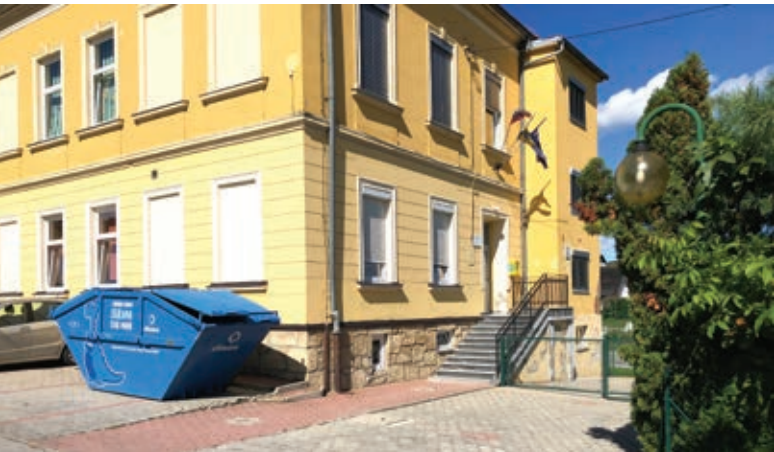
Lokacija defibrilatorja ob OŠ v Žitečki vasi

V začetku letošnjega šolskega leta smo namestili že peto AED napravo na območju naše občine. AED je nameščen na lokaciji stavbe OŠ Duplek, podružnice Žitečka vas, na naslovu Zg. Duplek 98.