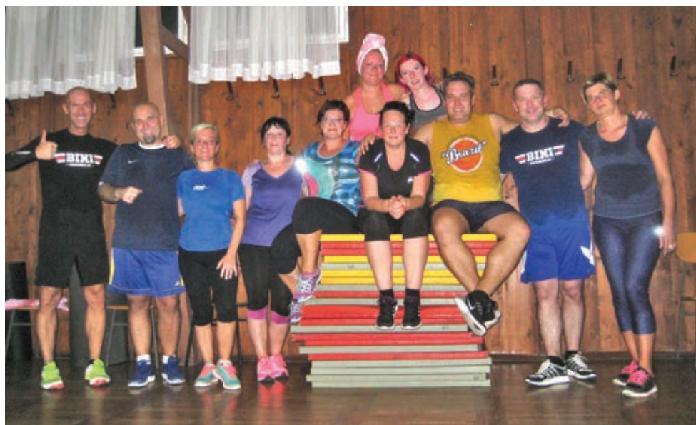
Skupina udeležencev vodene vadbe v Bini akademiji