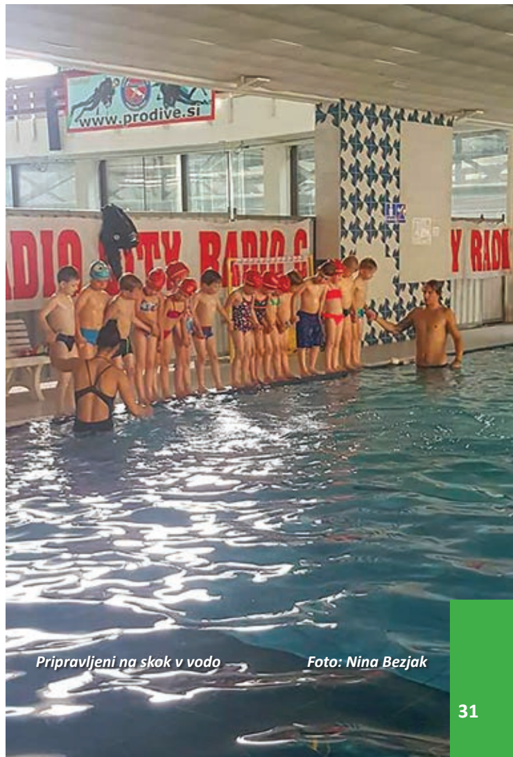
Pripravljeni na skok v vodo

Po pričakovanjih smo – kot vedno – ugotovili, da je voda sicer voda, da pa je za prehod od kopanja v domači kadi do plavanja v globoki vodi vendarle potrebno izvesti nemalo ponovitev osnovnih vaj za prilagajanje na vodo, učenje vdihov in izdihov, vadili smo pravilno, sproščeno lego na vodni gladini, vse to nadgradili s tehnično kar najbolj pravilnimi udarci nog, naposled pa smo pričeli zamahovati še z rokami. Takšen je načrt začetnega tečaja učenja plavanja. Po knjigah.