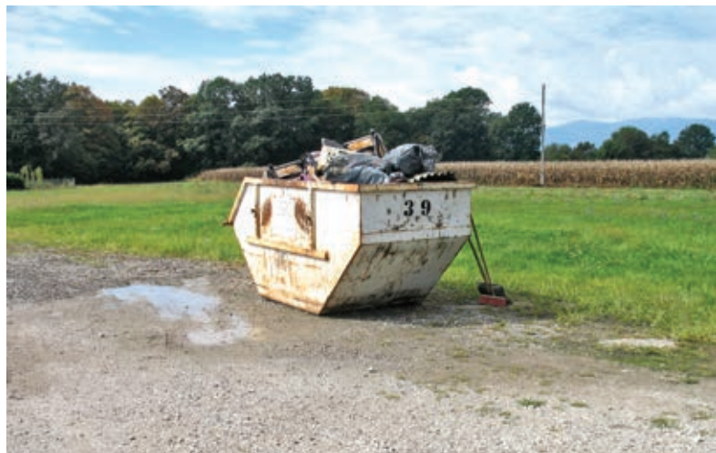
Napolnili smo kontejnerje