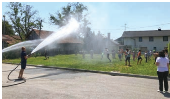
Prijetna ohladitev ob koncu