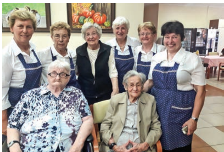
Na obiska v Domu sv. Lenarta