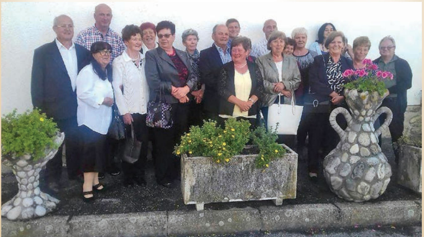
Sošolci in sošolke z učiteljicami generacije učencev Osnovne šole Korena 1960–1968 pred cerkvijo Sv. Barbare