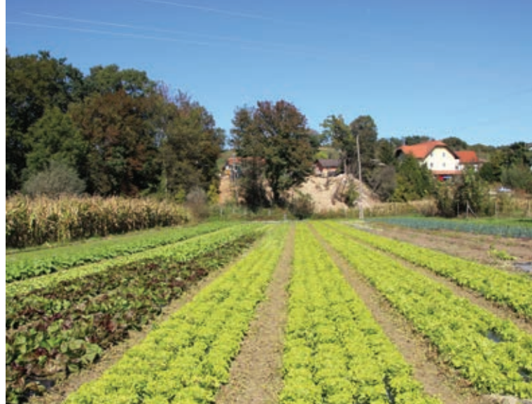
Pridelki s kmetije

Pridelke prodajajo lokalnim kupcem na svojem domu in na bližnjih tržnicah. Že od vsega začetka, tj. skoraj