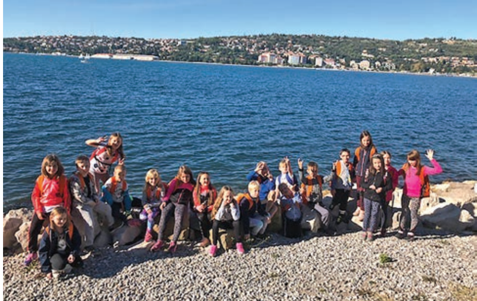
Tretješolci uživajo v šoli v naravi