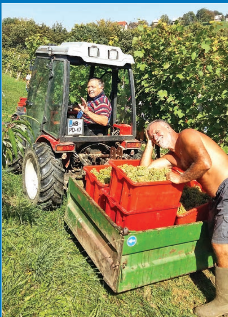
Trgatev Oldtimerjev pri Kurniku 2018