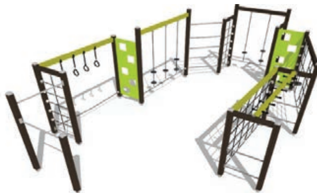
Primer motoričnega sestava

V vmesnem času smo skladno z Zakonom o javnem naročanju izvedli postopke izbire izvajalcev, da bomo takoj po prejemu odgovora s strani Agencije lahko pristopili k podpisu pogodb. Za dobavo in postavitve opreme parka za izboljšanje motoričnih sposobnosti je bilo izbrano