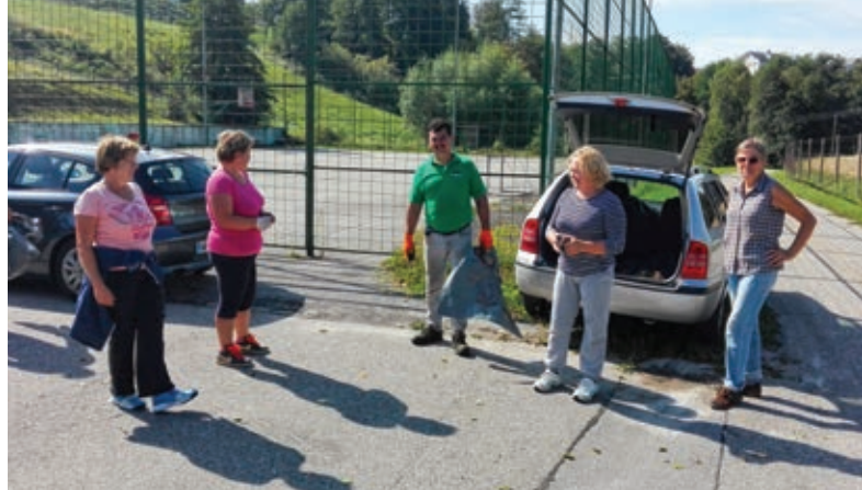
S skupnimi močmi do čistejšega okolja

Na zaključku smo ob skupni malici vsi sodelujoči vedeli, da čistilna akcija z delovnim nazivom Še zadnjič ne pomeni, da smo s tem svoje delo zaključili. To je šele za-