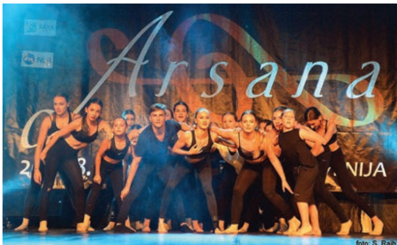
Zaključna predstava Art dance campa

Vanese se je tudi letos (kot že leta 2016 in 2017) udeležila Art dance campa v sklopu festivala Arsana na Ptuj, kjer vsakič še nadgradi svoje plesno znanje v hip hopu, disco dancu, jazzu, modernu in contemporaryju. Z zaključno predstavo je skupaj s plesalci iz cele Evrope pričarala čudovito plesno zgodbo, s katero so ganili občinstvo minoritskega samostana.