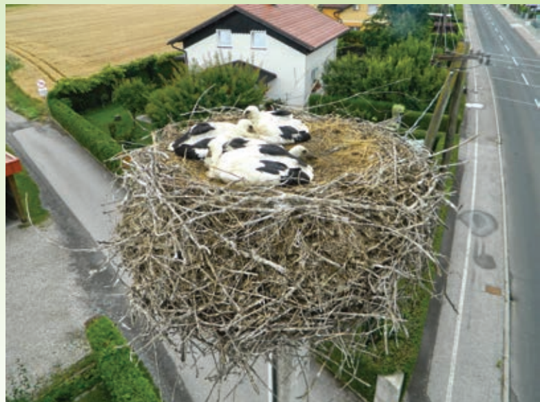
Letos so bili v gnezdu 4 mladiči štorkelj. Zg. Duplek, 25. 6. 2018.

Pretegovanje in urejanje perja, Sp. Duplek, 13. 7. 2018.