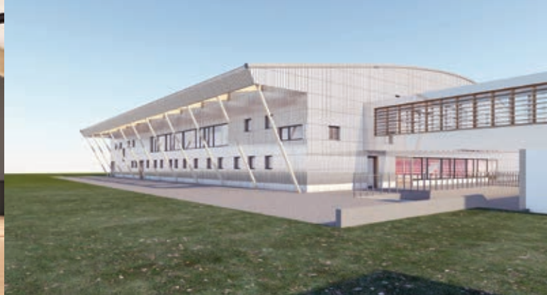
Zunanost dvorane s povezovalnim hodnikom; pogled s SV strani, Arhitekt Šmid d. o. o.