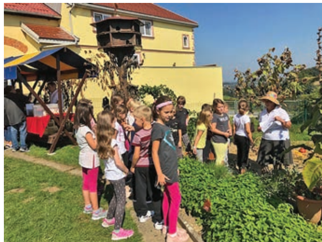
Tretješolci na zeliščnem vrtu