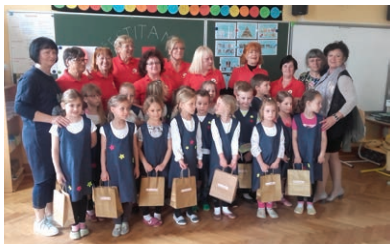
Sprejem mladih članov