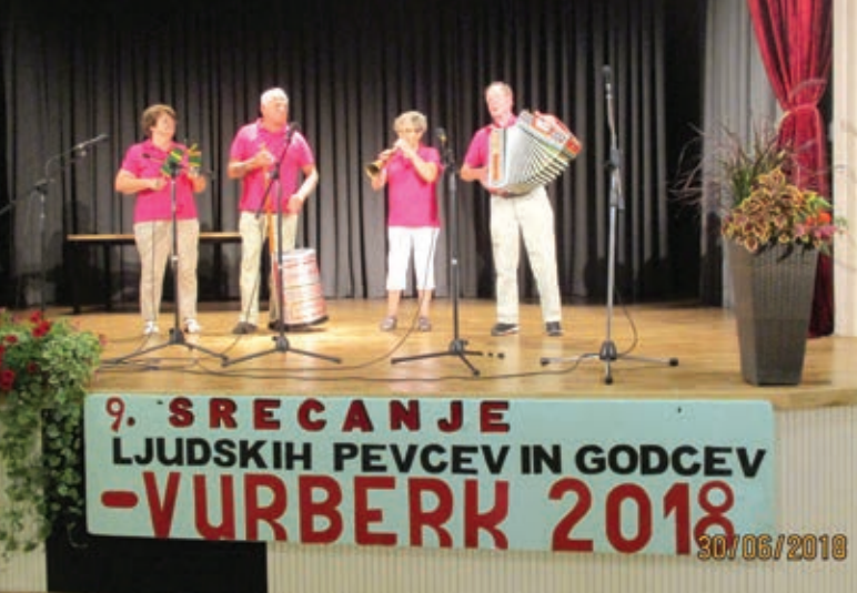
Nastop malečniških godcev