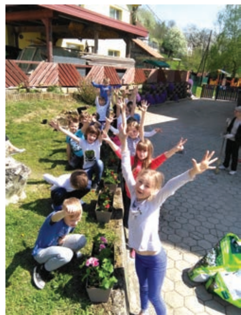
Otroci so okrasili šolo