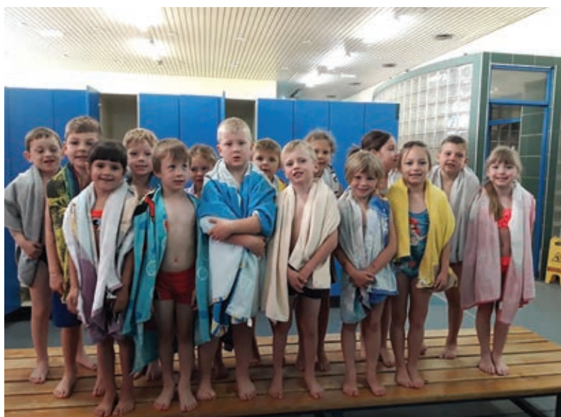
Plavalci in plavalke