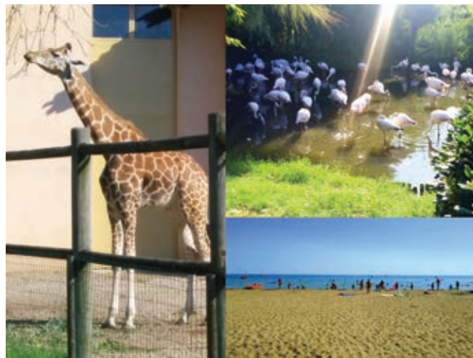
Nepozaben izlet v Italijo

zelo hitro premikati glavo navzgor in navzdol, ko si stopil do njega. Šli smo še do tjulnjev in nilskih konjev, nato pa smo prišli do koz. Tam smo bili najdlje, saj smo pri avtomatu kupili nekaj briketov in smo jih nato nahranili ter kar nekaj časa božali. Ena koza je kar obrnila glavo in šla stran, ko je opazila, da oče nima nobene hrane. Ogledali smo si še bizone, srne ter želve, pri katerih smo prevedli, da ko se želva izvleče, je majhna kot zamašek (odvisno od vrste). Okoli 11.00 smo zapustili živalski vrt ter se odpravili na bližnjo plažo.