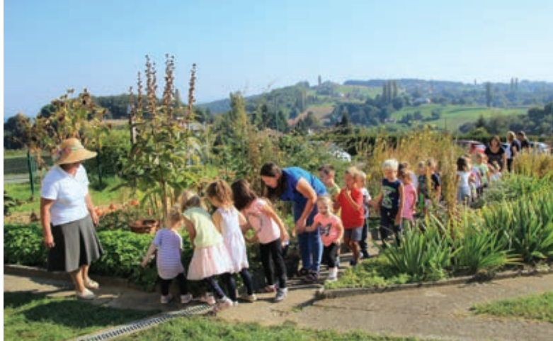
Otroci vrtca iz Korene na ogledu vrta