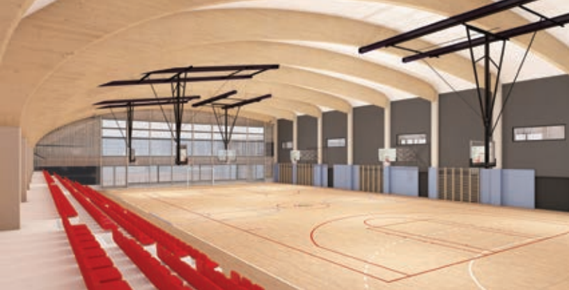
Vpogled, trije vadbeni prostori in tribune, Arhitekt Šmid d. o. o.