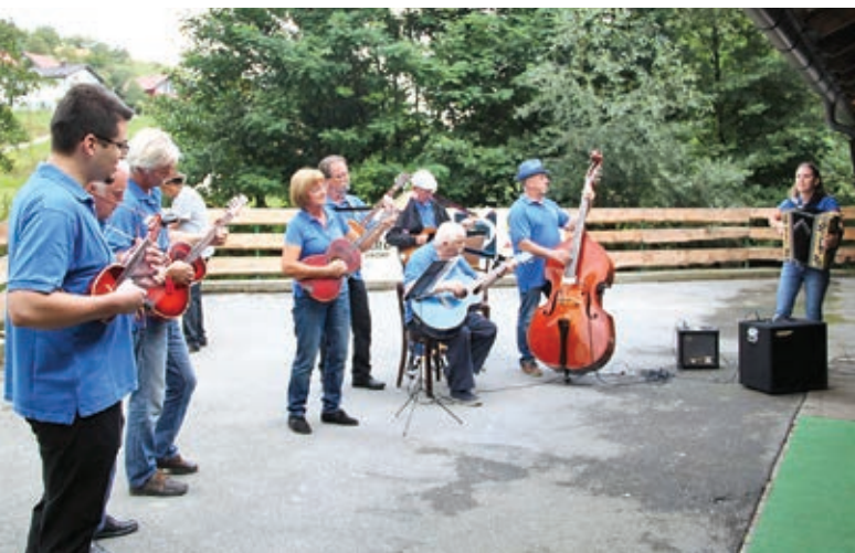
Likovna kolonija Duplek art 9