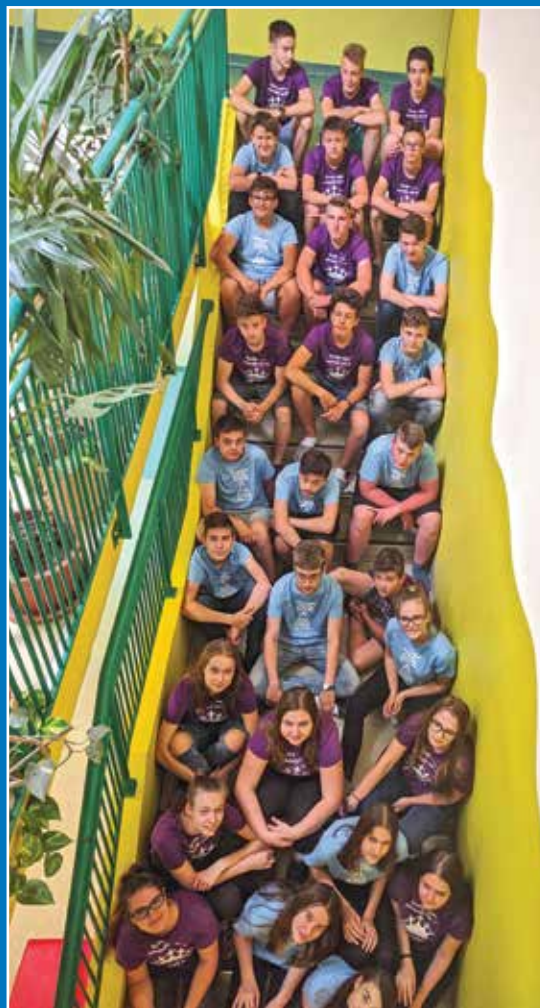
Valeta OŠ Duplek