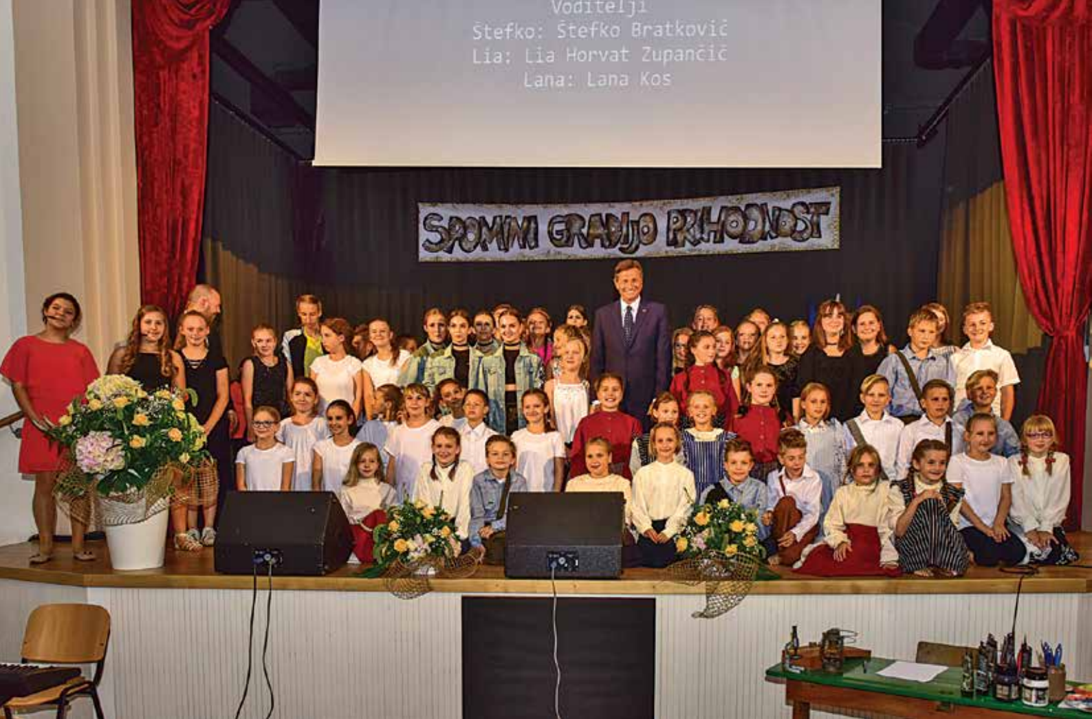
Predsednik RS Borut Pahor na svečani akademiji ob 40-letnici OŠ Duplek, 120-letnici podružnične šole Žitečka vas in 125-letnici podružnične šole Dvorjane