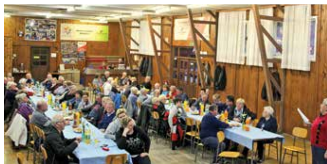
Občni zbor Društva DKK

Iz letnih poročil je bilo razvidno, da je društvo uspešno realiziralo vse točke programa 2017. Tako so imeli v aprilu 2017 svoj redni letni občni zbor, za praznik občine Duplek so izvedli tradicionalni dupleški rally, v avgustu pa svoje društveno srečanje. Sledila sta kostanjev piknik in zaključek leta. Skozi leto so bili udeleženci aktivni na prireditvah v občini, na srečanjih, vožnjah prijateljskih društev po letnem koledarju SVS in pri drugih rednih aktivnostih, odzvali pa so se tudi na povabila društev.