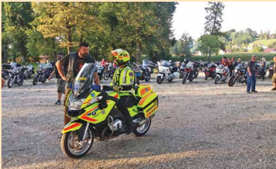
Black Dragons na obisku pri Oldtimerjih