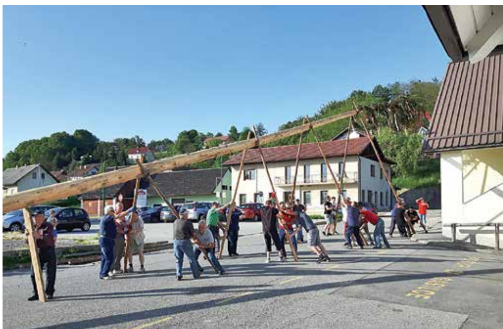
Postavljanje majskega drevesa

V ponedeljek, 30. aprila 2018, smo v sodelovanju z vaško skupnostjo Dvorjane tradicionalno postavljali majsko drevo.