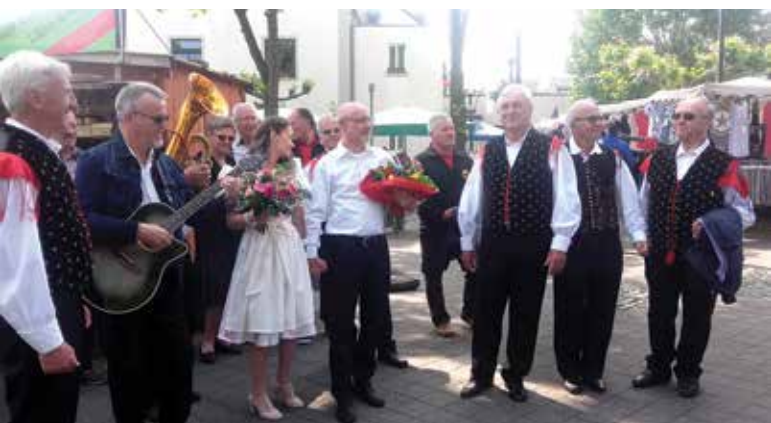
Pred občinsko stavbo so novoporočence presenetili Fantje izpod Vurberka