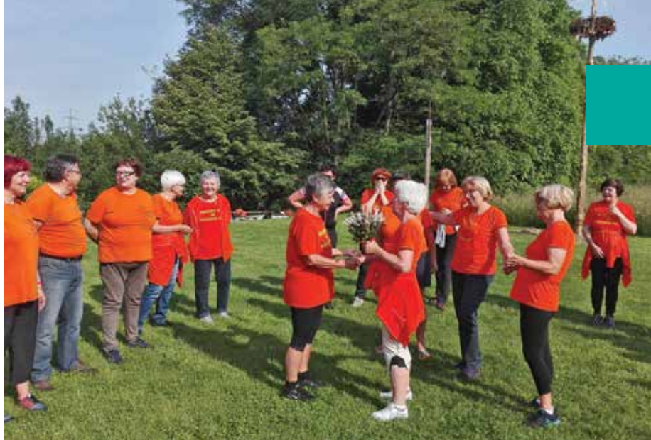
Čestitke ob 3. obletnici delovanja

Zadani cilji so seveda velik zalogaj in vsake dodatne roke