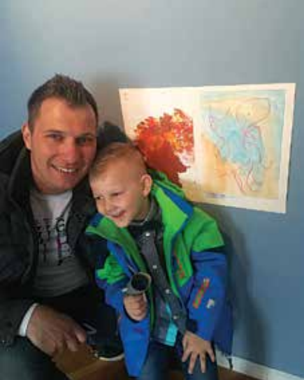
Žak in ati ob razstavljeni risbici