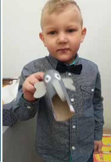
Žak s svojim izdelkom