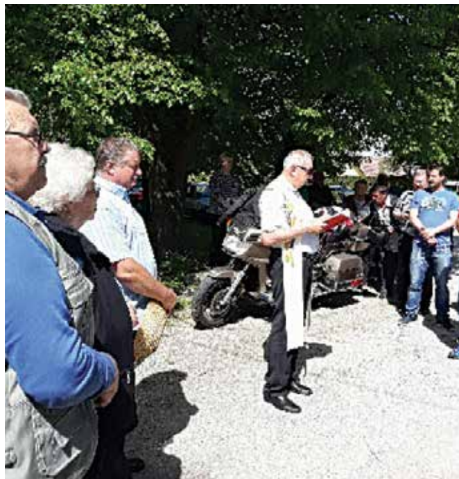
Blagoslov vozil in motorjev v župniji Sv. Martin pri Vurberku – Dvorjane

Na panoramski vožnji po krajih občine Duplek je bilo prisotnih 60 starih vozil. Sledila sta zaključek srečanja in počastitev delavskega praznika. Udeleženci so se zbrali in zaključili svoje srečanje v Zg. Dupleku pri Kolariču. Spomnili so se delavskega praznika in postavili majsko drevo. Prijetno druženje je ob kulinarčnih dobrotah trajalo do poznega večera.