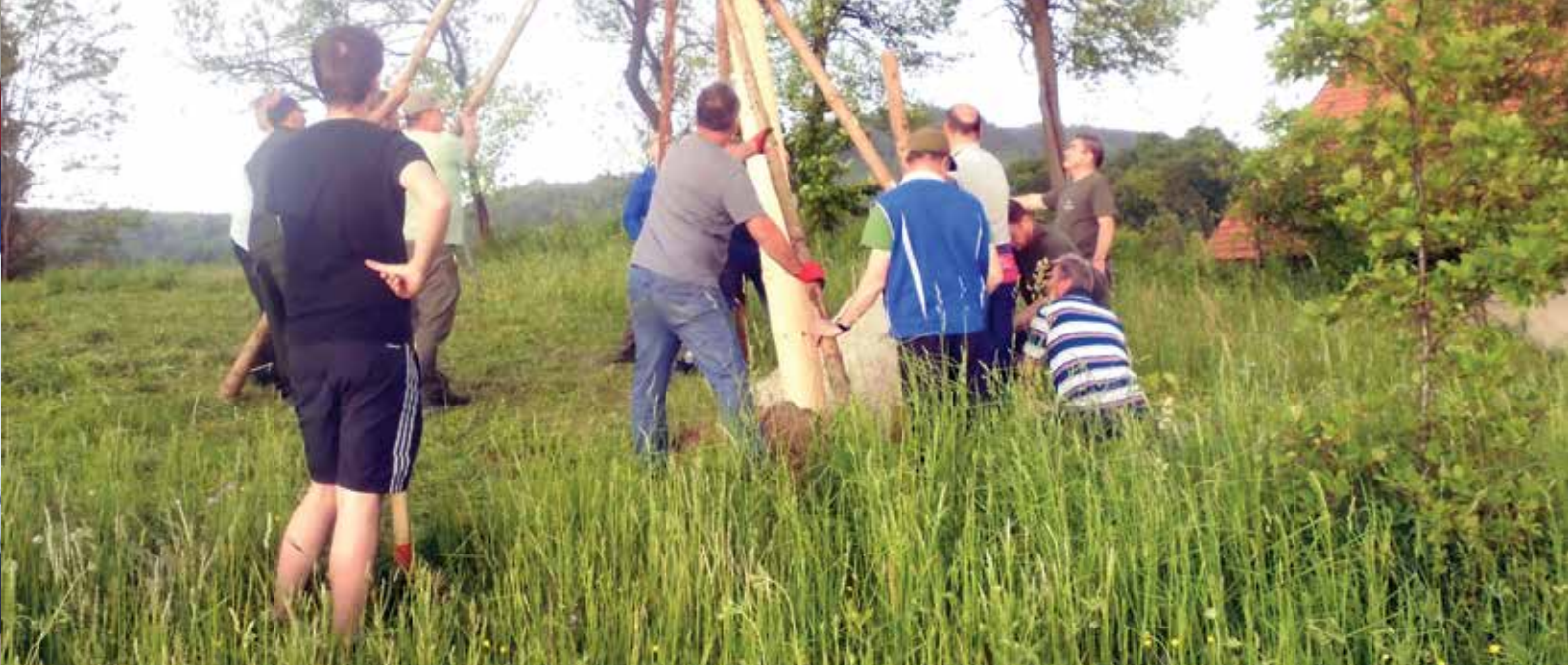
Postavitev majskega drevesa