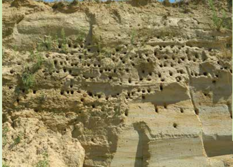
Pogled na del gnezdišča breguljk