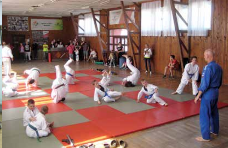
Prikaz borilne veščine Aikido na dnevu odprtih vrat Bini Akademije