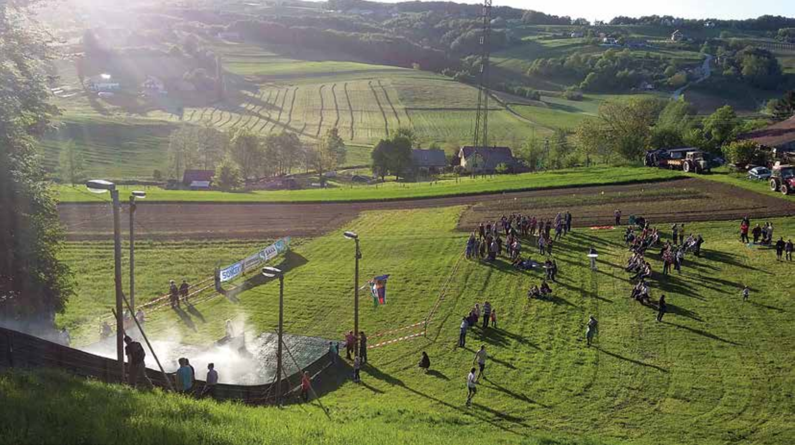
Pogled na Jablanca s skakalnic