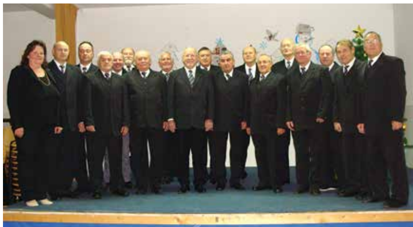
Moški pevski zbor KUD Franc Preložnik Dvorjane

Seveda se na koncu še enkrat zahvaljujemo vsem nastopajočim.