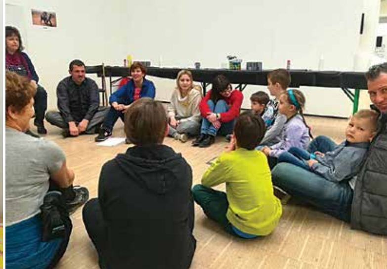
Žak v svoji skupini