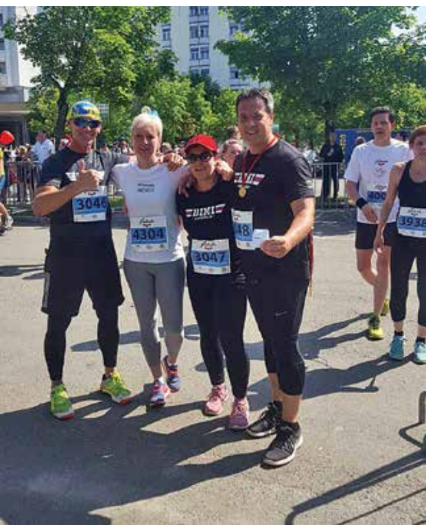
Tekači Bini Akademije na 38. maratonu Radenci 2018

vodim skupinsko vadbo za starejše in ljudi s posebnimi potrebami. Punce so velik vzor vsem ostalim. Vadbo obiskujejo redno dvakrat tedensko v dopoldanskem času, z veliko discipline in odrekanih pa so rezultati zelo vidni. Punce povedo, da se počutijo odlično, imajo več energije kot kadar koli, stresa ne poznajo in so po vadbi nerazdružljive. To šteje največ, zato se še vedno sprašujem, dragi moji, zakaj niste z nami, saj so naše vadbne prilagojene vsakemu posamezniku. Vaje izvajamo z lastno telesno maso in s pripomočki po lastni zmogljivosti. To vam lahko pomaga pri razmisleku, da postanete tudi vi naš član družine in se nam pridružite že danes. Spoštovane moje vadeče, moja dolžnost je, da vas danes pohvalim pred vsemi, preprosto zato, ker ste carice svojega življenja!