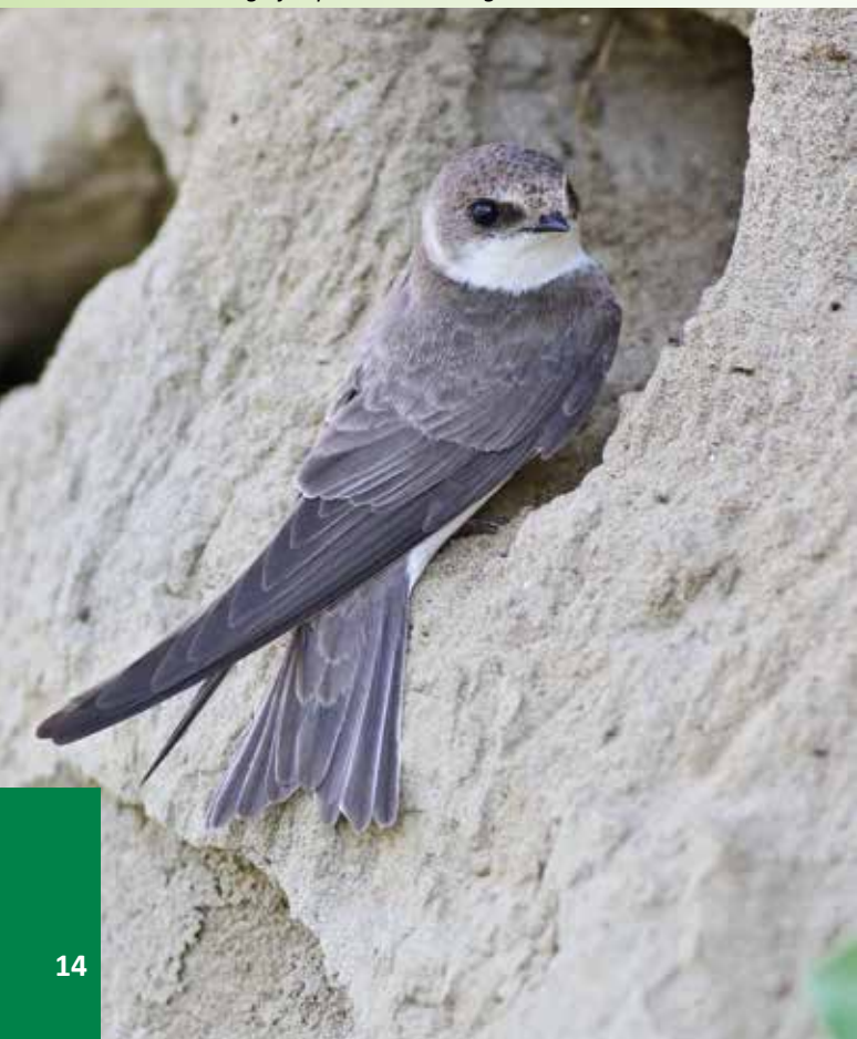
Odrasla breguljka pred vhodom v gnezdilni rov

izkopavanja gramoza in peska nastajajo strme peščene stene. Breguljke ponujena umetna gnezdišča zelo hitro naselijo, a žal tudi tukaj niso povsem varne, zato jim že vrsto let poskušamo pomagati z izdelavo gnezdilnih sten. V Društvu za opazovanje in proučevanje ptic Slovenije (DOPPS) tako vsako leto z delovnimi akcijami načrtno pripravljamo gnezdilne stene ob bregovih rek, v gramoznicah in peskokopih, torej povsod tam, kjer obstajajo pogoji za to, torej vsaj 2 metra debel sloj peska.