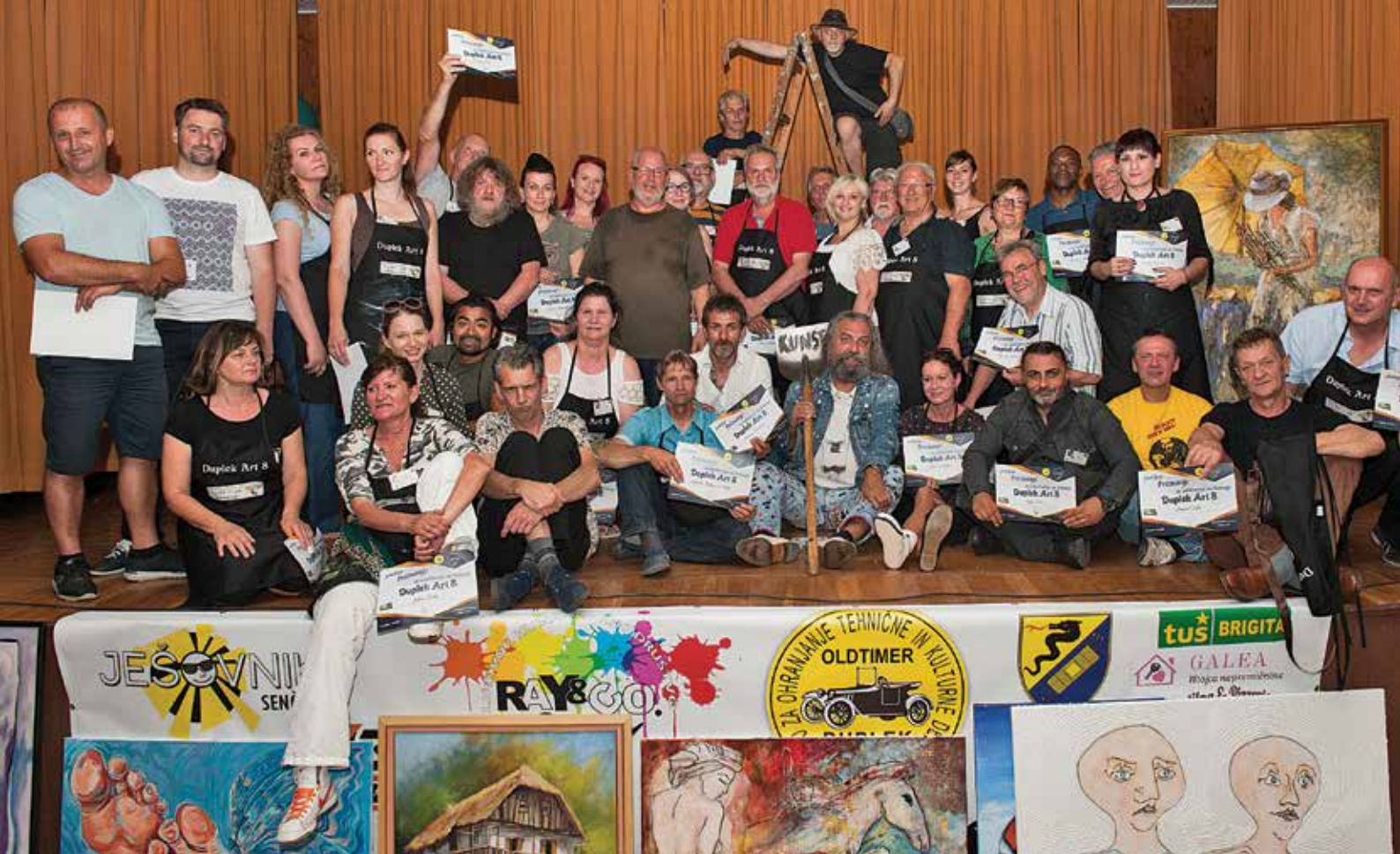
Udeleženci Duplek Art 8