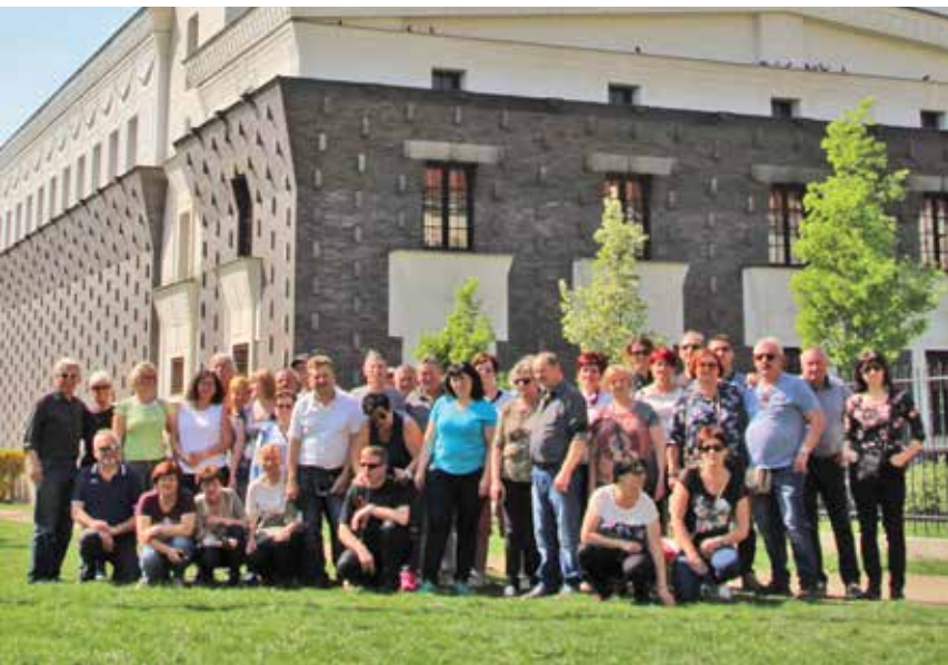
Člani TD občine Duplek na izletu