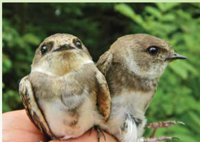
Breguljke med postopkom obročkanja

V Sloveniji živi pet vrst lastovk. Poleg že omenjene kmečke lastovke, ki gnezdi najpogosteje v hlevih domačih živali in je med ljudmi tudi najbolj poznana, pa ime mestna lastovka Delichon urbicum pove, kje ta vrsta živi. Seveda jo srečamo tudi izven mest, v vaseh in običajno na večjih kmetijah. Značilna zanjo so sezidana gnezda na zunanjih zidovih stavb, pod napušči streh, pod mostovi in podobno. Nekoliko redkejše so skalna lastovka Ptyonoprogne rupestris , rdeča lastovka Cecropis daurica ter najmanjša med našimi lastovkami – breguljka Riparia riparia , s katero se bomo danes nekoliko bolje seznanili. Breguljka je ena izmed najbolj razširjenih ptic na zemlji. V zmernem podnebnem pasu naseljuje skoraj celotno