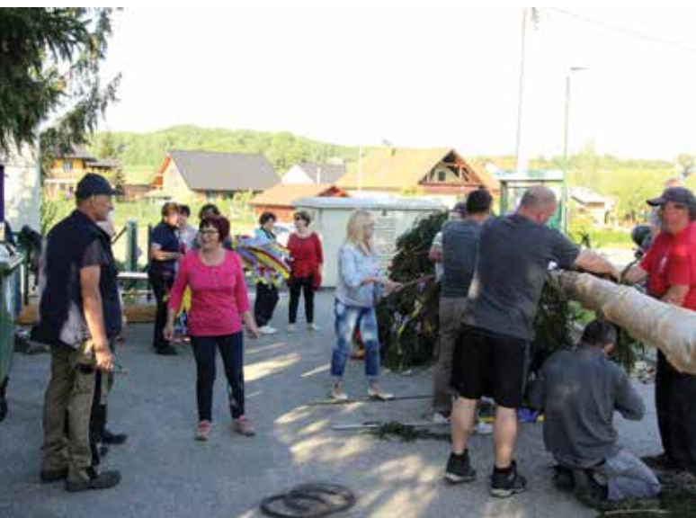
Priprava majskega drevesa

vih krajanov (vse od spravila drevesa iz gozda, prevoza, priprave – okrasitve do postavitve mlaja) počastitev delavskega praznika ne bi uspela.