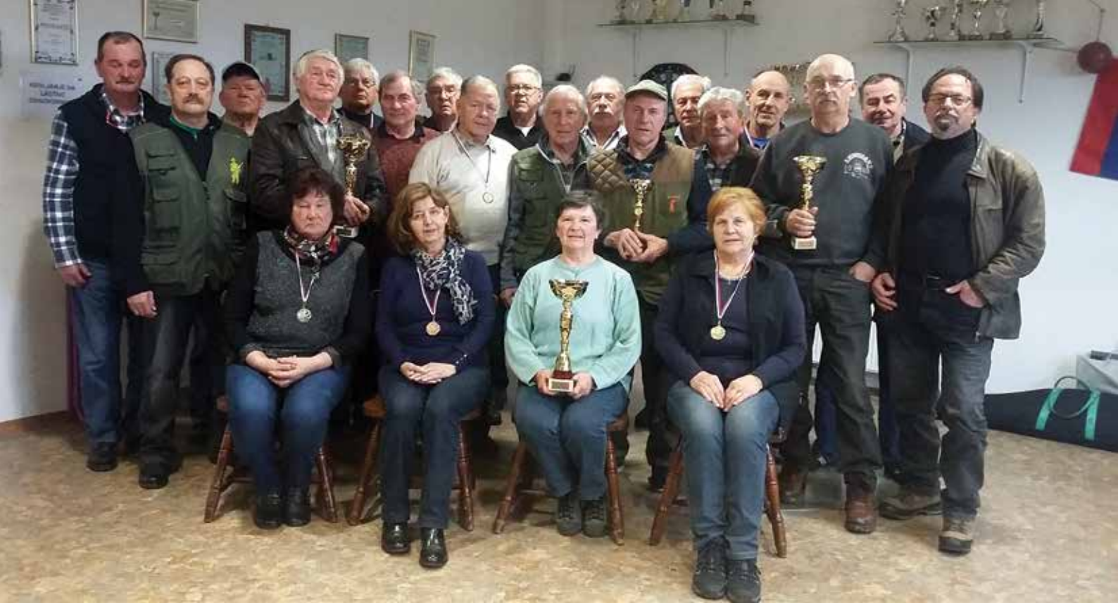
Udeleženci Zimske lige v Pesnici