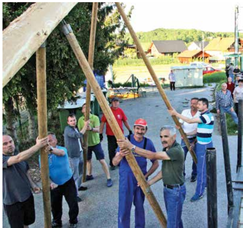
Moč delavstva je v slogi – tudi pri postavljanju mlaja

Cvetje – krasitev drevesa je običajno v domeni ženskih predstavnic. Pri tem si vrle udeležence prizadevajo dodati vsaka svojo vejico ali trakec pri okrasitvi, da bi bilo drevo lepše. S prigrizki in še s čim pa organizatorji poskrbijo za dobro razpoloženje, ki traja pozno v noč. Brez prizadevnih članov VS in TD občine Duplek ter marljivi-