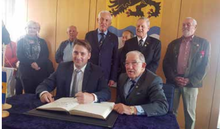
Vpis v Zlato knjigo