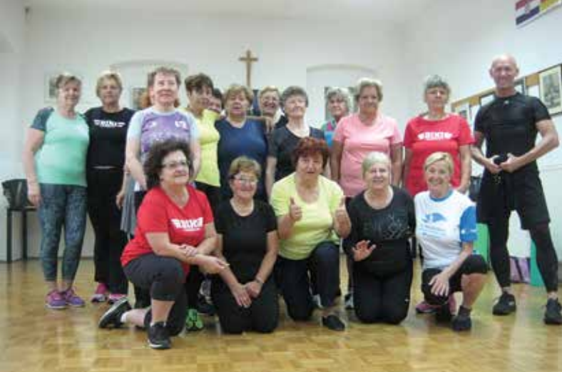
Pridne vadeče punce MGC DANica Duplek po vadbi vedno dobre volje in nasmejane