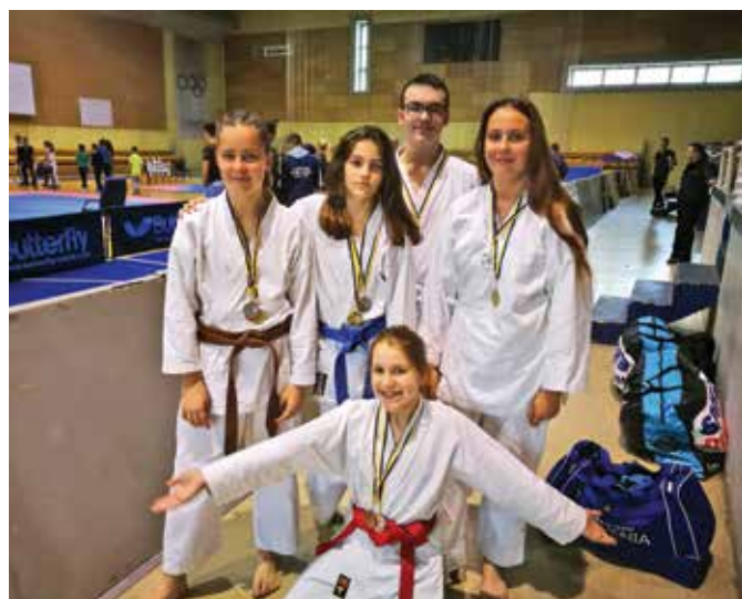
Naši tekmovalci v Sarajevu

Čestitamo vsem za odlične nastope, ki jih v prihodnosti gotovo ne bo zmanjkalo.