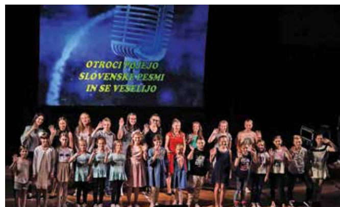
Skupinska fotografija nastopajočih