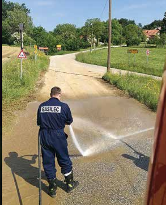
Posledice neurja v Spodnjem Dupleku