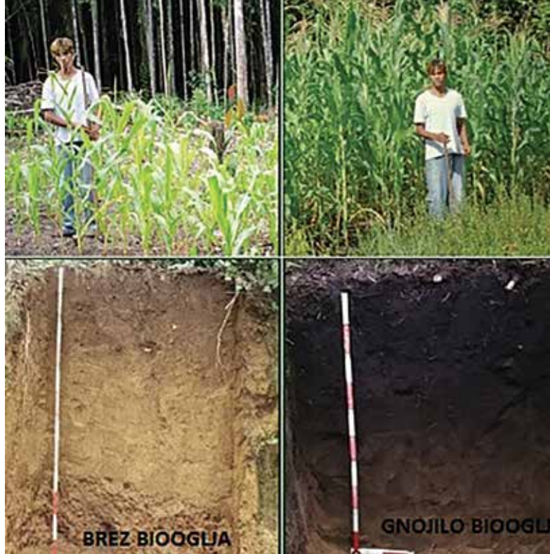
»Biooglje.jpg« Biooglje povečuje rodovitnost prsti

Raba biooglja za gnojilo omogoča shranjevanje ogljika v prsti več sto ali celo tisoč let. Oglje izboljšuje rodovitnost tal, saj stimulira rast rastlin, ki porabljajo CO 2 , s čimer je dosežen povratni učinek rabe CO 2 . Energija, pridobljena kot del proizvodnje biooglja, izpodriva pozitivno označene ogljike iz energije, pridobljene iz fosilnih goriv. Do-